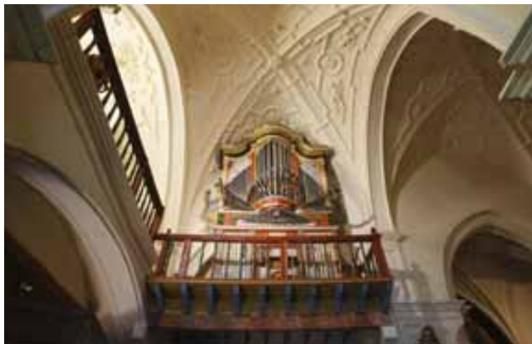
MUSICA EN EL CAMINO. El órgano de Itero fue restaurado recientemente por Fundación del Patrimonio.

Además en la localidad se mantiene un ambiente vivo y activo que impulsa los elementos arquitectónicos y patrimoniales