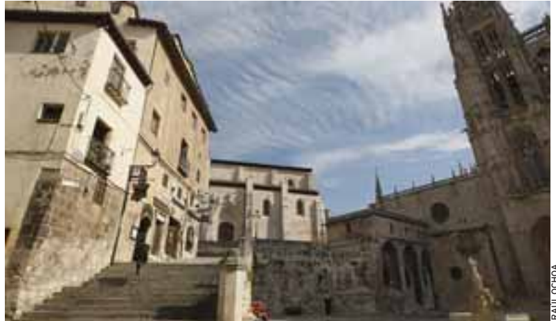
SABOR MEDIEVAL. Las calles del centro histórico de Burgos guardan un rancio sabor medieval que se refleja en los trazados y en los edificios góticos, vestigio de la grandeza de la ciudad

En los alrededores de la Catedral sus callejas angostas y retorcidas nos trasladan a la historia y a las viejas historias de una ciudad que ha forjado su pasado en torno al Camino de Santiago. Siglos después del primer esplendor de la ruta, dos Patrimonios de la Humanidad se dan la mano en un mismo punto, la basílica y el Camino.