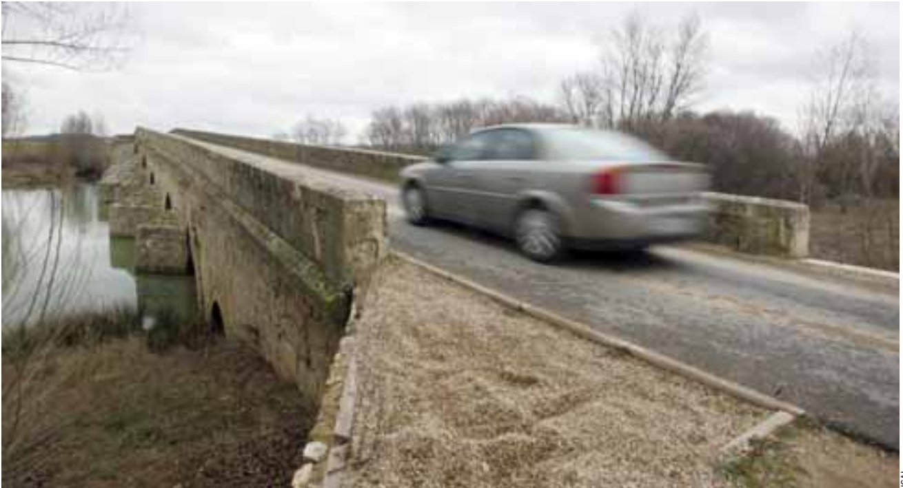
PUENTE DE ITERO. Puenteñero marca el límite de las provincias de Burgos y Palencia.