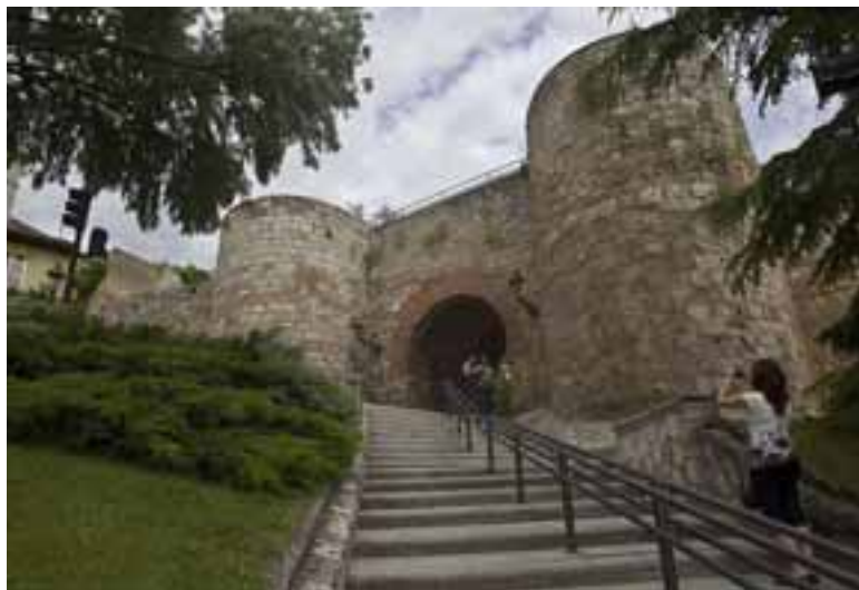
ARCO DE SAN MARTÍN. La calle de Fernán González en todo su trazado hasta San Martín fue la más noble de la ciudad en los años del medievo y en el Renacimiento. En ella residían los adinerados de la urbe.

El caminante abandona esta parte de la ciudad por la misma calle de Fernán González donde se puede encontrar tres monumentos importantes: el arco de Fernán González, el Solar del Cid y el Arco de San Martín, antaño puerta de entrada de los peregrinos a la ciudad. La curiosidad de este último es llamativa. En su interior se dice que tenía la medida de la espada del Cid, la Tizona.