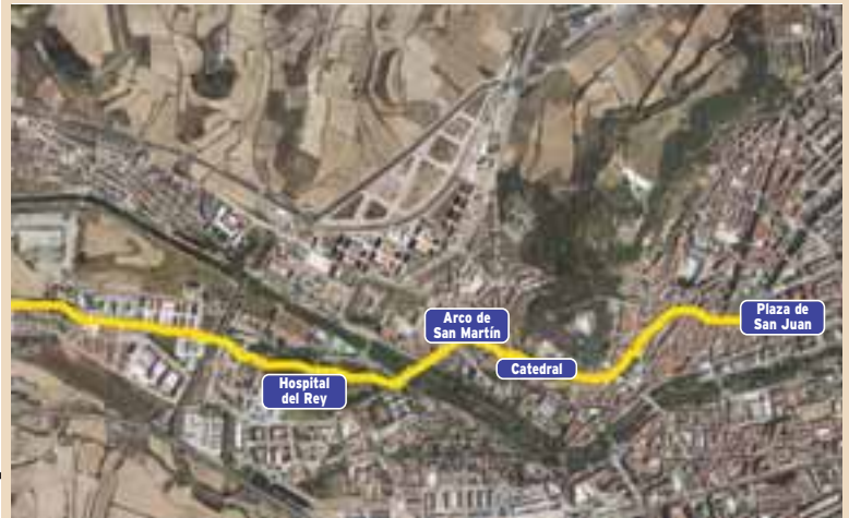
El mapa del Camino en Burgos. Partiendo de la plaza de San Juan, el caminante aún ha de atravesar media ciudad por su zona más noble antes de abandonar la por el Hospital del Rey y la Milanera.

nacentistas y un profuso y decorado retablo del altar mayor de estilo barroco.