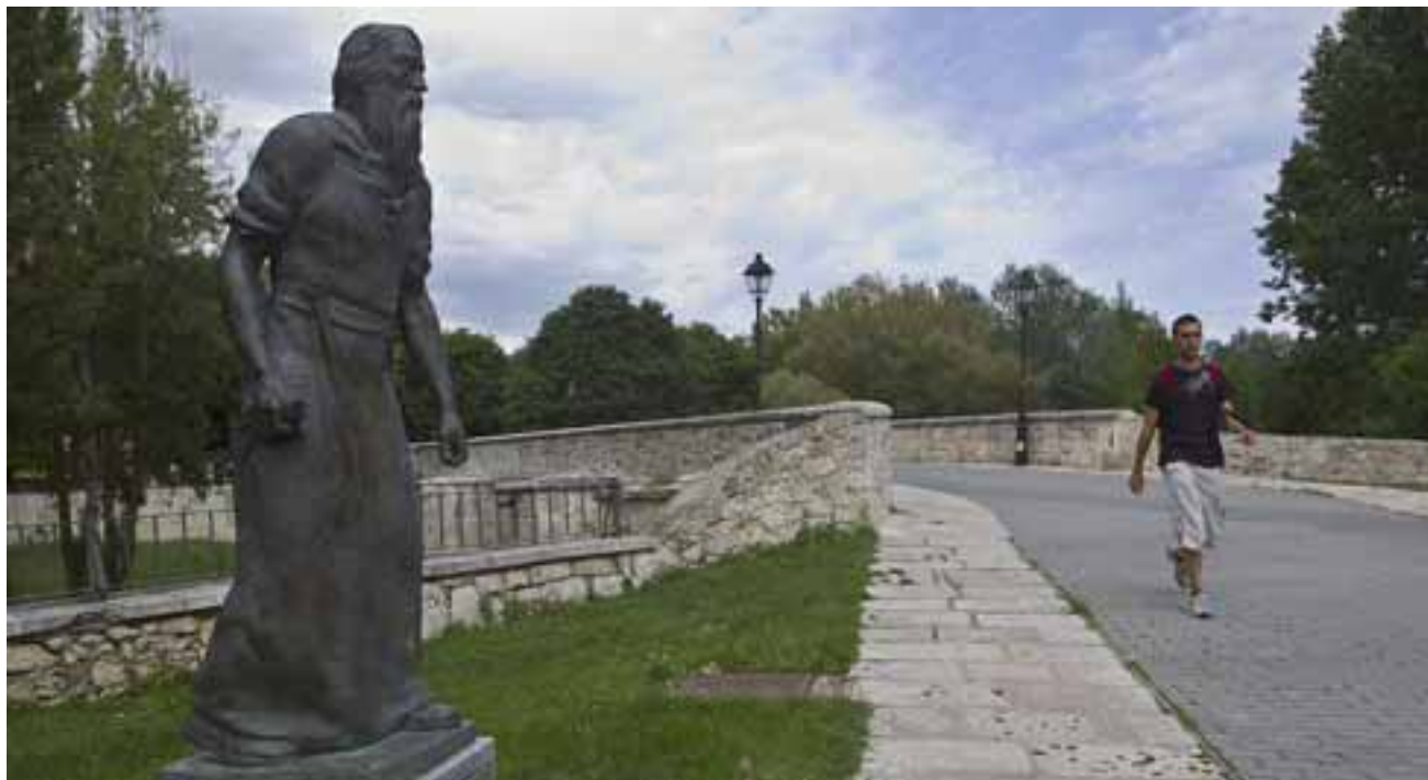
ALIENTO EN EL CAMINO. la estatua de Santo Domingo de Guzman alienta a los caminantes en el tramo de salida de la ciudad.