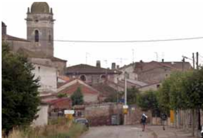
RABÉ DE LAS CALZADAS. Responde al prototipo de pueblo del Camino de Santiago con sus pequeñas calles y sus acogedoras gentes que reciben con regocijo a los peregrinos de Santiago.

Las referencias también acercan a Rabé al medioevo. En la localidad existió, en la época de la Reconquista, levantado sobre un montículo llamado la 'Nevera' una fortaleza de la que no quedan vestigios. Entre sus edificios más notables destaca el Palacio del Conde Villariego del siglo XVII.