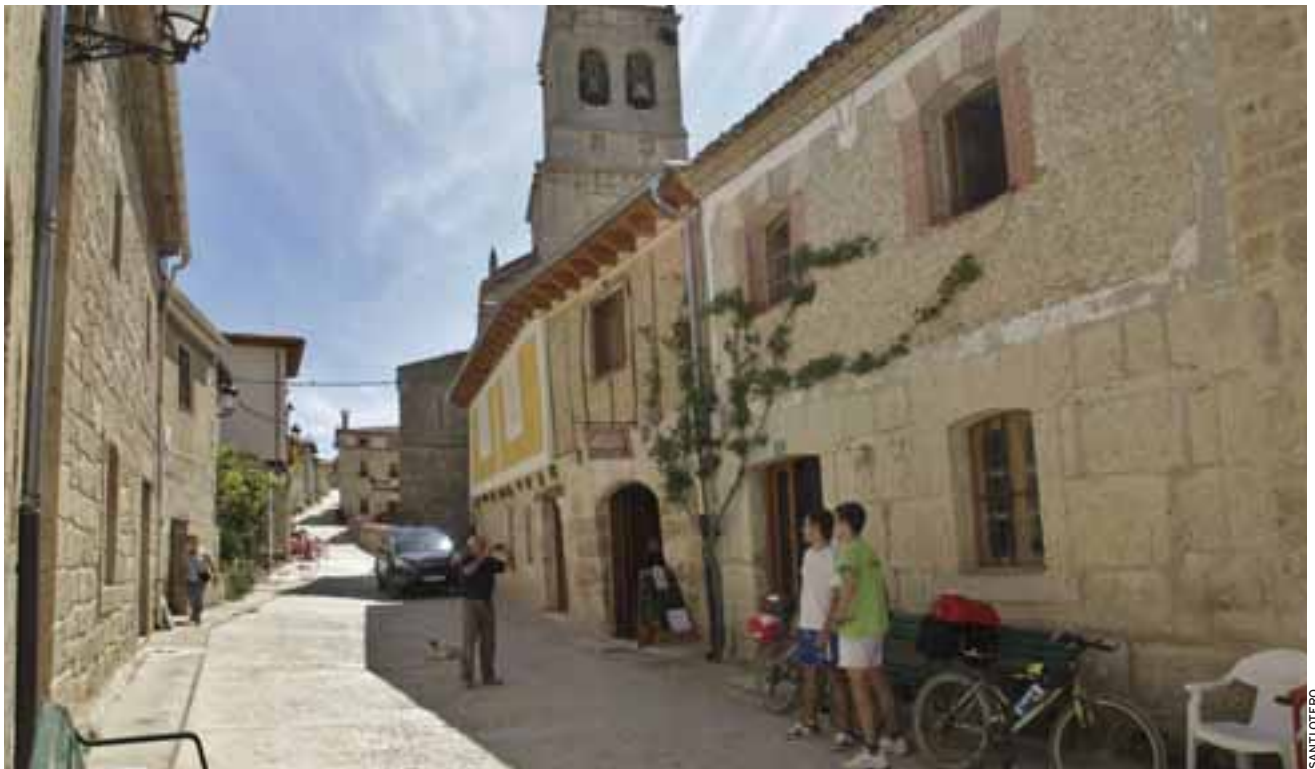
VIDA DE PUEBLO. La localidad revive durante el año santo con la vida que aporta a sus calles los peregrinos que pasan noche en Hontanas.