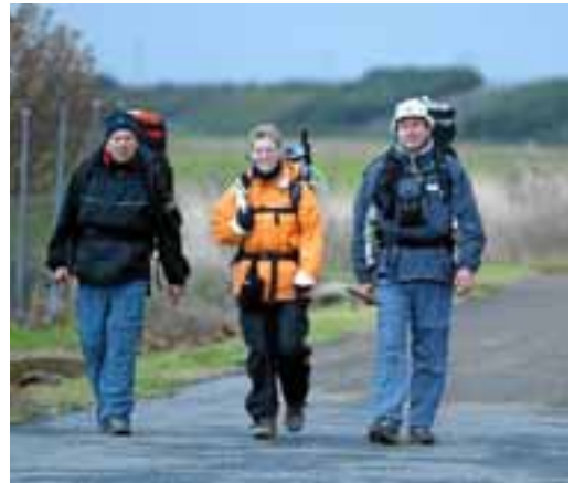
DESCANSO. Cardañuela cuenta con un albergue que ofrece hasta 16 plazas y el bar de la localidad que sirve comidas.

Son actividades de las que no sólo disfrutarán los lugareños y veraneantes sino, también, los peregrinos que durante esos días discurran por Cardañuela o Villalval. Todo ello unido al buen recibimiento que todos reciben de los vecinos de estas localidades acostumbrados desde niños a la figura del peregrino que desde tiempo inmemorial transitaba por estas tierras. Hoy, como en todas las pequeñas localidades por las que atraviesa el camino, la ruta se ve como una importante oportunidad no sólo de promoción sino también de negocio. Aquellos que se encuentran en ruta compran en cada pueblo su alimento, pernoctan en los albergues y se toman un buen plato en la cantina.