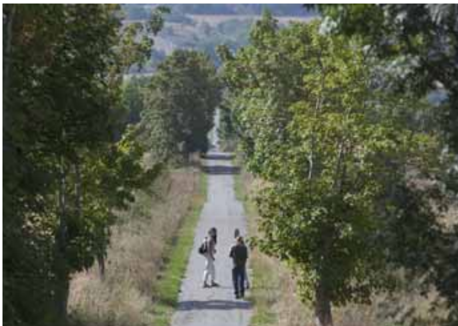
MÁS ÁRBOLES. La idea que inspiró el proyecto es enseñar lo sencillo que es plantar un árbol y está relacionada con la costumbre de los peregrinos de transportar una piedra para purgar pecados hasta la Cruz de Ferro.

En los últimos estudios, se ha determinado que este hongo es una especie con la que se han logrado hallazgos sorprendentes: de él se extrae la ergobasina, un alcaloide relativamente simple con una gran capacidad hemostática y potenciadora de las contracciones del útero; la ergotamina, un vasoconstrictor muy empleado en la actualidad como antimigrañoso y que ingerido en cantidades elevadas de manera continua durante el embarazo da lugar a malformaciones; dietilamida del ácido lisérgico, más conocida como LSD.