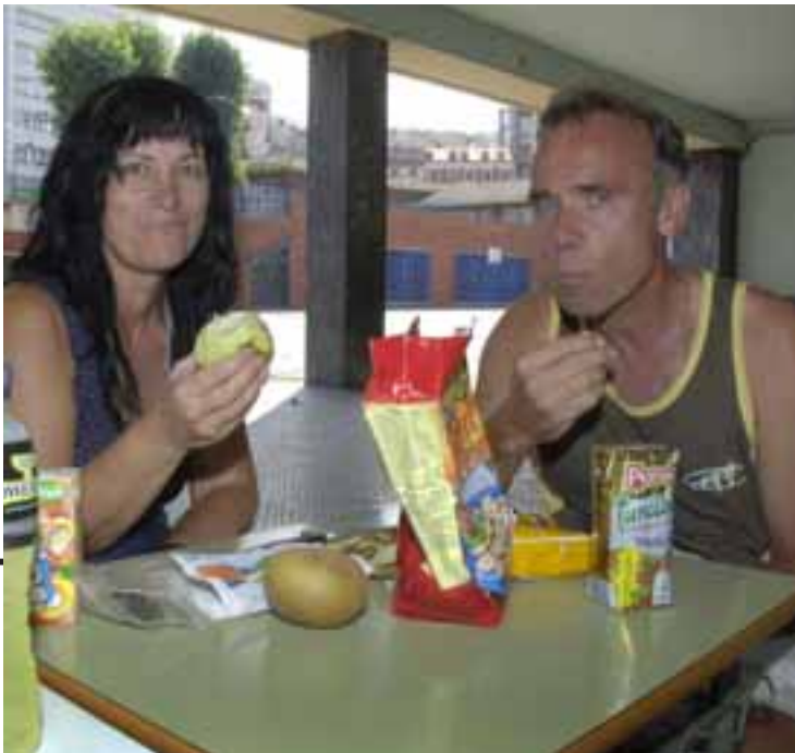
TIRANDO DEL 'HIPER'. Gran parte de los peregrinos del Camino de Santiago deciden comprar su comida en hipermercados o comer en albergues, a veces de manera obligatoria debido a su escaso presupuesto. Los 'tourigrinos' se pueden permitir el lujo de comer en restaurantes u hoteles de alrededor.

GASTRONOMÍA Las diferencias de antaño en relación con los más 'privilegiados' siguen existiendo, unos tiran de albergue e 'hiper', otros de hotel y restaurante