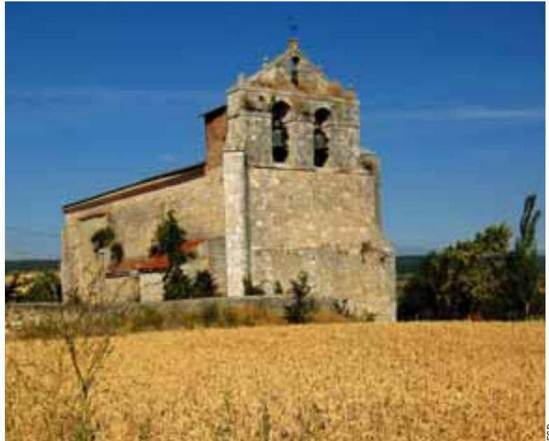
IGLESIA. La iglesia de Santa Eulalia es, junto con la fuente romana y los dólmenes de Villalba, un hito en el pueblo. Y es que tiene en su interior un retablo que procede de la Catedral de Burgos.

Son actividades de las que no sólo disfrutarán los lugareños y veraneantes sino, también, los peregrinos que durante esos días discurran por Cardañuela o Villalval. Todo ello unido al buen recibimiento que todos reciben de los vecinos de estas localidades acostumbrados desde niños a la figura del peregrino que desde tiempo inmemorial transitaba por estas tierras. Hoy, como en todas las pequeñas localidades por las que atraviesa el camino, la ruta se ve como una importante oportunidad no sólo de promoción sino también de negocio. Aquellos que se encuentran en ruta compran en cada pueblo su alimento, pernoctan en los albergues y se toman un buen plato en la cantina.