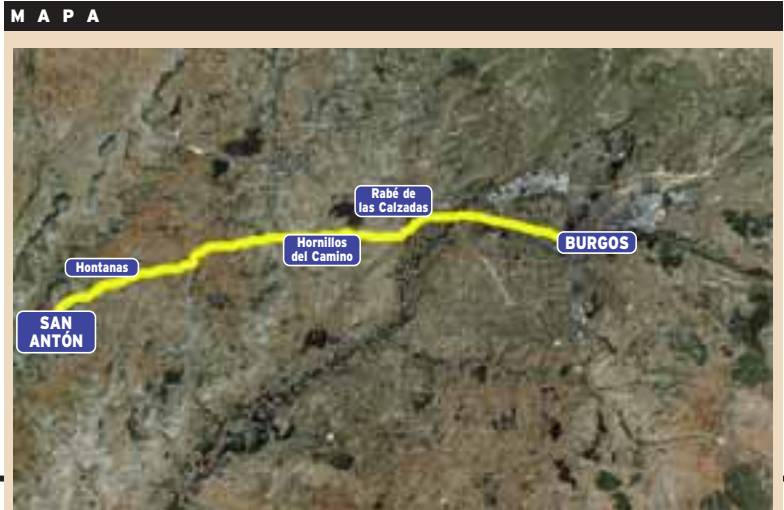
El mapa del Camino en Burgos. El peregrino sale desde el Hospital del Rey, cuna y panteón real, para tomar camino de San Antón pasando por Villalbilla, Tardajos, Rabé de las Calzadas, Hornillos y Hontanas.

Cada año, la villa cercana a la capital de Burgos celebra una fiesta de la patata en octubre en la que se reparten más de 2.000 kilos de patatas. Platos de todos los olores, colores y sabores se dan la mano en la tradicional