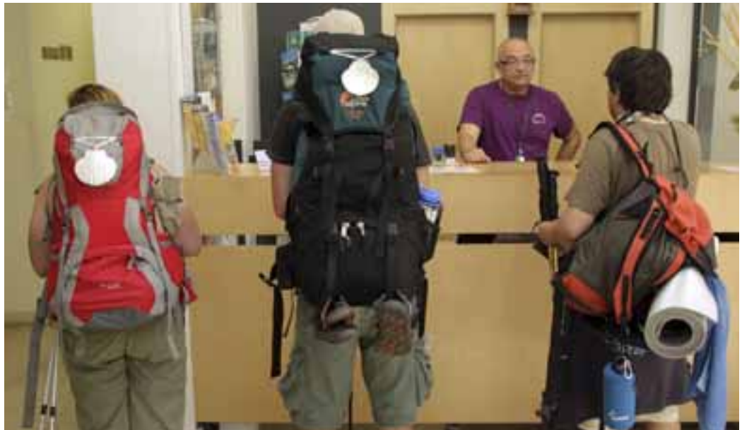
LLEGADA A BURGOS. La Casa del Cubo recibe diariamente a unos 200 peregrinos venidos de distintas partes del mundo.

tas pendientes. Tampoco con el fin de encontrarse a sí misma. El motivo por el que esta joven asiática se halla inmersa en los kilómetros compostelanos tiene forma de libro. «En su momento leí una obra del comediante alemán Peter Kerkeling en la que se aludía al Camino y me dije, ¿y por qué no lo hago?», explica tranquilamente. Y, tranquilamente, echó andar rumbo a Santiago.