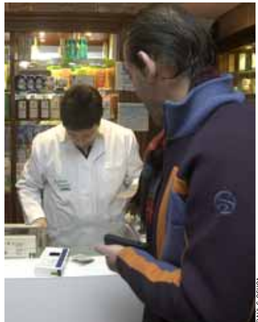
SALUD. Farmacias y Centros de Salud ubicados en torno al Camino de Santiago han facilitado información y asesoramiento a los peregrinos.

Y como el Camino de Santiago a trasapado las fronteras de Europa, ha sido necesario habilitar sistemas que permitieran hacerse entender entre unos y otros. El idioma es fundamental y más en lo que se refiere a la salud. Por ello, desde la Junta