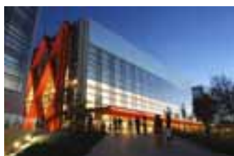
EL NUEVO. Los peregrinos apenas lo ven de lejos pero prometen volver para verlo.

La nueva instalación se ha convertido en uno de los elementos turísticos clave en la ciudad y desde la Asociación de Guías de Burgos se lo muestran, de lejos, al final de la ruta para peregrinos.