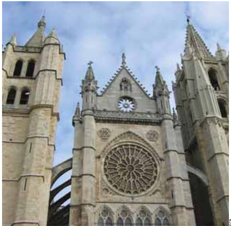
'LA PULCHRA LEONINA'. Si San Martín es el ejemplo más claro del románico jacobeo, la Catedral de León es la perfección gótica con su planta y sus inigualables vidrieras.

Pereje; Trabadelo; Portela de Valcarce; Ambasmestas; Vega de Valcarce; Ruitelán; Las Herrerías; La Faba y La Laguna de Castilla son pasos previos antes de llegar a la lucense población de O Cebreiro.