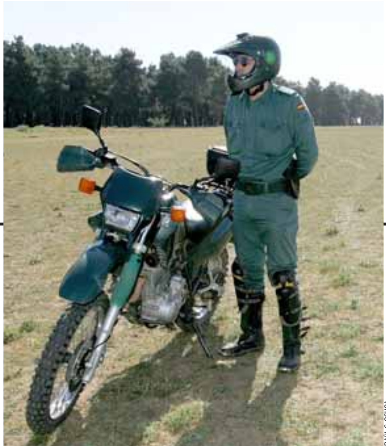
EFFECTIVOS DE SEGURIDAD. La Delegación del Gobierno en Castilla y León ha incluido en el Plan Verano 2010 de seguridad el Camino de Santiago. A la Guardia Civil se le ha sumado Protección Civil.

La atención a los peregrinos se ha prestado en varios idiomas, además del español funda-