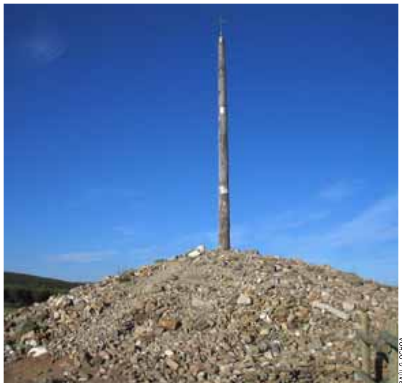
EL MITO DE LA CRUZ DE FERRO. El peregrino debe parar en este enclave para arrojar su piedra antes de continuar su marcha hasta la 'mecca' jacobea del Campo de las Estrellas.