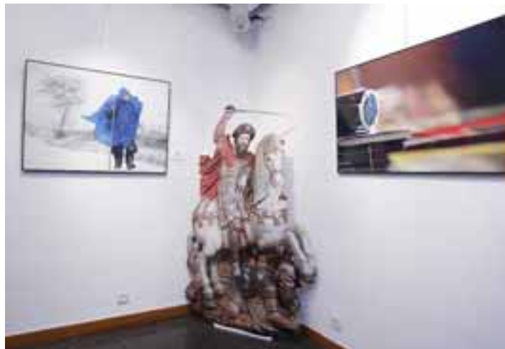
EXPOSICIÓN. Briviesca acogerá la muestra que ya se pudo ver en Burgos.

Esta exposición ya estuvo presente en el Consulado del Mar de la capital burgalesa el pasado mes de mayo coincidiendo con la celebración del Congreso Internacional sobre las rutas e itinerarios del Camino de Santiago. Asimismo, según comentó Francés el objetivo es que una vez que finalice el itinerario previsto, la muestra pueda viajar a más localidades.