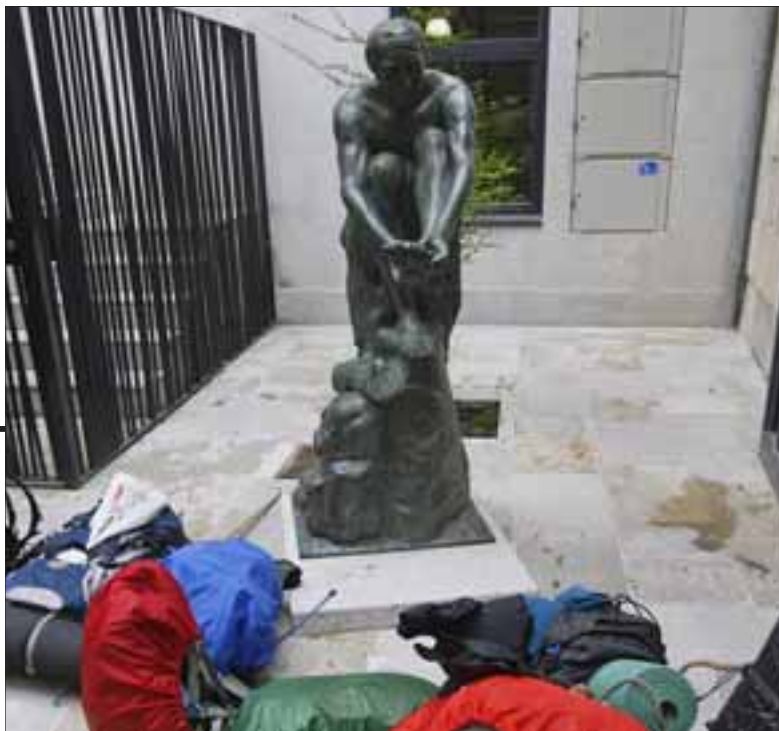
29.000 PEREGRINOS. Ésta es la cifra que se estima podría cumplirse al finalizar el Año Santo Compostelano. Aunque, como ha sucedido en el verano, podría haber sorpresas.

Entre las medidas para interesar a las nuevas generaciones y garantizar el relevo generacional en la Asociación así como mostrar el valor real de una ruta de estas características la Asociación de Amigos del Camino se ha acercado a 4.500 escolares. Se trata de una medida que se ha llevado a cabo en colaboración con los centros educativos de Burgos y que han permitido recorrer el camino y conocer el albergue. Una medida que forma parte de las actividades culturales y didácticas realizadas en este año santo, de ingente trabajo.