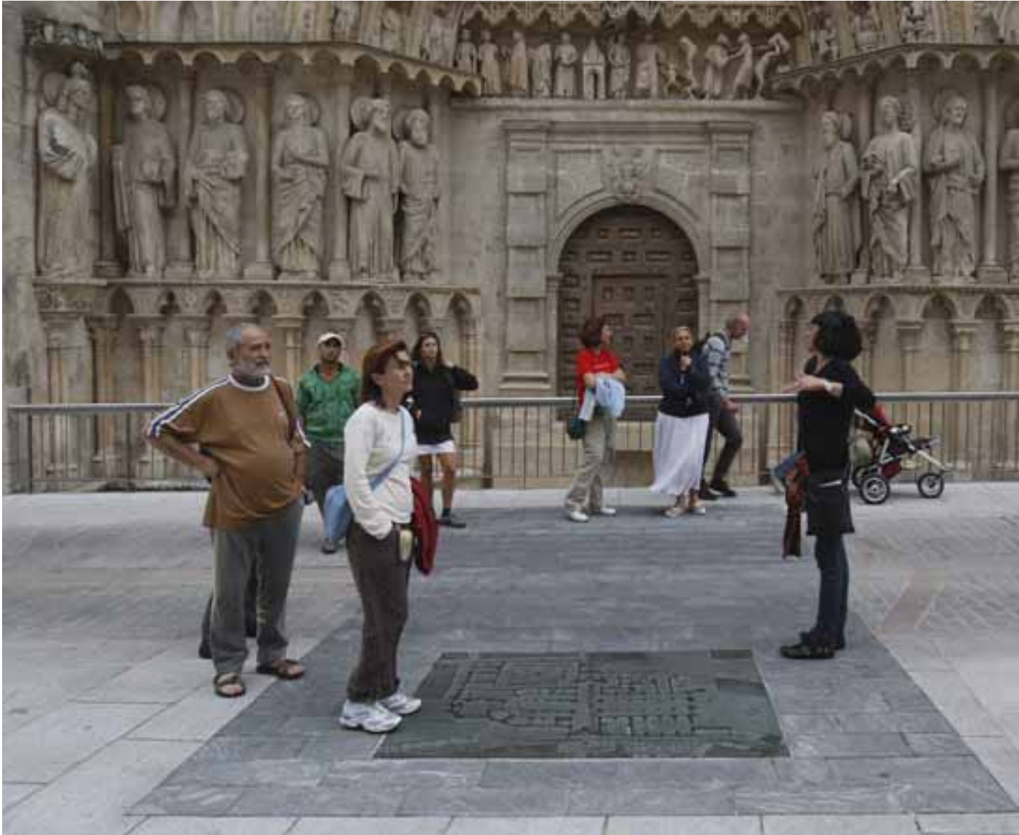
A LOS PIES DE LA CATEDRAL. Por el Camino de Santiago se adentran a conocer algo más que las piedras de la catedral. Interesan más sus historias. Aquí arranca la ruta guiada. Después se desviarán del camino para acceder a la Plaza del Rey San Fernando, la Puerta de Santa María y pasear por el Espolón desde donde podrán ver, de lejos, el nuevo Museo de la Evolución.