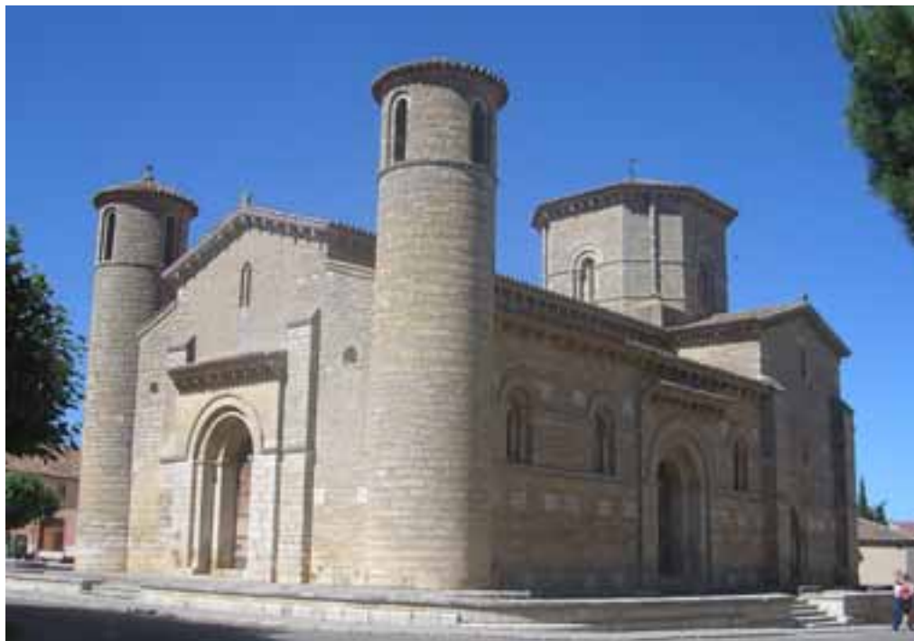
SAN MARTÍN, EN FRÓMISTA. Es el monumento románico más perfecto. Sus líneas, sus sillares y su estratégica ubicación en el Camino de Santiago la colocan en las guías de los lugares de poder de la ruta jacobea en Castilla y León.

des de entrar en la población condal. Su existencia consta desde el siglo X cuando se la conocía por el nombre de su parroquia, Santa María. Desde esa época aparece como sede de la poderosa familia castellana de los Beni-Gómez. Tras la incursión de castigo