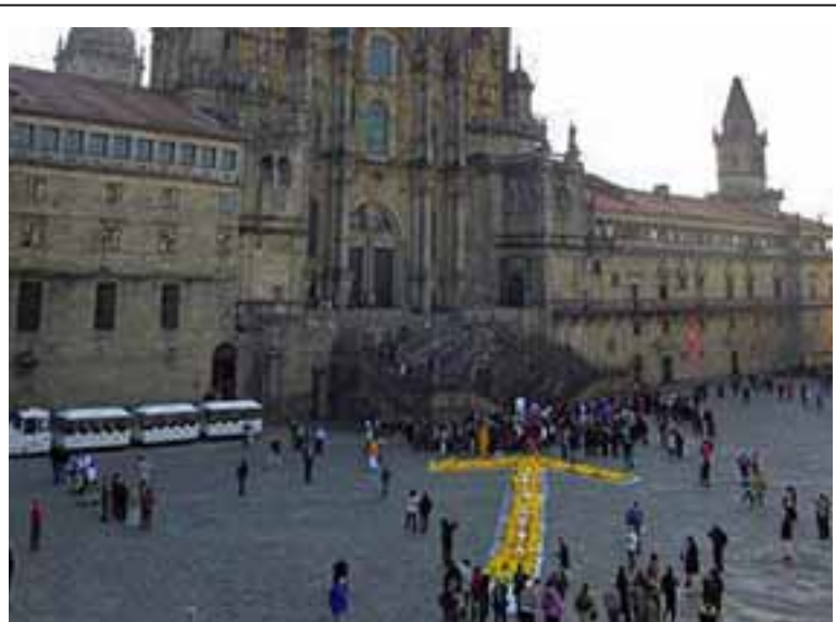
TIEMPO DE DESCANSO. La Asociación de Amigos del Camino de Santiago en Ávila culminó ayer su peregrinación de nueve etapas a Santiago de Compostela por todo el Camino Francés, que inició en el año 2008. Al llegar a la plaza del Obradoiro, las 64 personas que completaron el Camino formaron una flecha humana amarilla y leyeron un escrito de apoyo a la ruta jacobea y a los peregrinos.