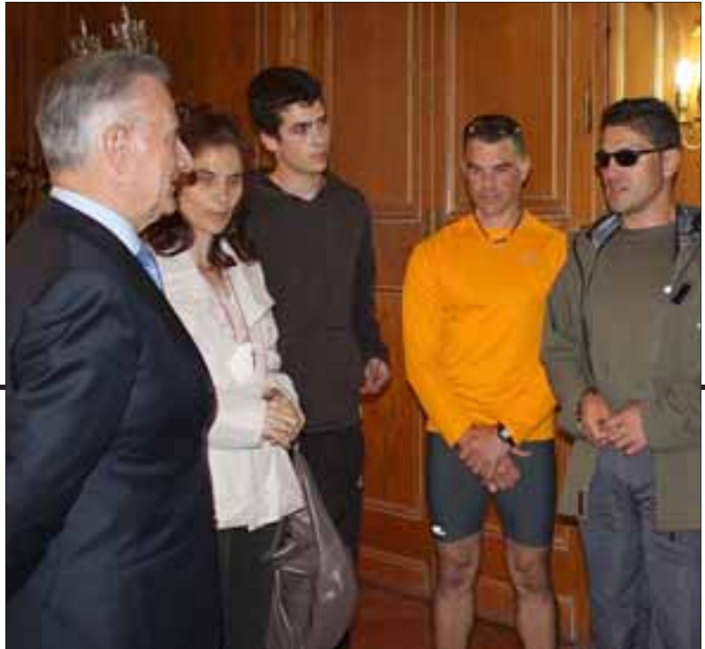
UNOS PEREGRINOS MÁS. El popular cantante (dcha) y la atleta burgalesa (junto al presidente de la Diputación), fueron recibidos a su llegada a Burgos el pasado día 14, tras concluir la etapa iniciada en Agés.

Añade que en la actualidad ésta avanza más rápido de lo que nosotros mismos podemos asumir por lo que creemos firmemente que somos esa fundación o asociación que hacía falta para que la gente pueda pensar que es la tecnología y cómo ésta puede pensarse e idearse para hacernos la vida más fácil a todos y con ello, a nosotros».