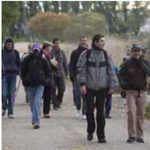
CON BUEN HUMOR. La actividad se desarrolló el fin de semana del 17 de octubre, siendo varias las etapas que realizaron los once presos.

El responsable de Programas del centro penitenciario, explicó que este recorrido en dos etapas del Camino tiene un valor especial, ya que «las salidas de un día saben a poco y perno-