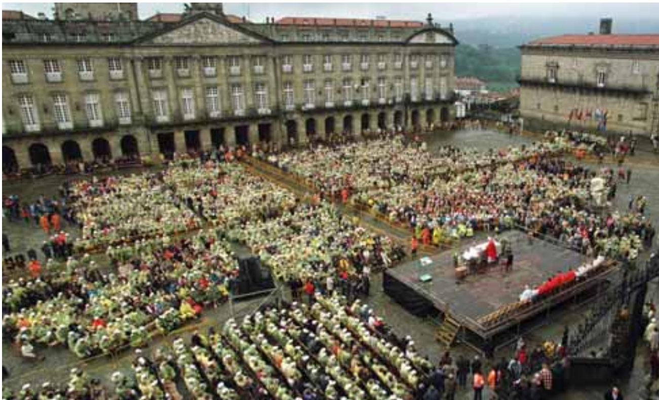
PLAZA DEL OBRADOIRO. El conjunto formado por el casco histórico de Santiago de Compostela es Patrimonio de la Humanidad desde 1985. Ocho años después se concedió el mismo reconocimiento a la ruta. Esta plaza es el destino final y aquí se puede ver al generador de la ruta, el Apóstol Santiago, en su faceta mística, como peregrino y como guerrero.

SANTIAGO DE COMPOSTELA La ruta llega a su fin. Ver botafumeiro y besar la imagen del Apóstol Santiago es cuestión de momentos para aquellos que han iniciado la ruta con un sentimiento religioso. Otros observarán satisfechos la inmensidad del Obradoiro y la satisfacción del reto logrado. Algunos seguirán hasta Finisterre.