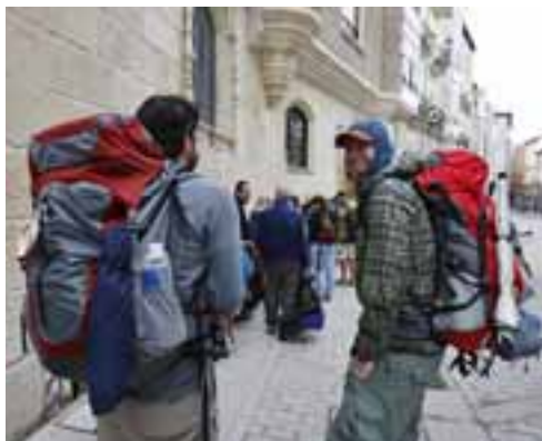
BALANCE. Muchos peregrinos prefirieron adelantarse al Año Santo.

Y es que, a punto de finalizar este periodo, las estimaciones hablan de que serán