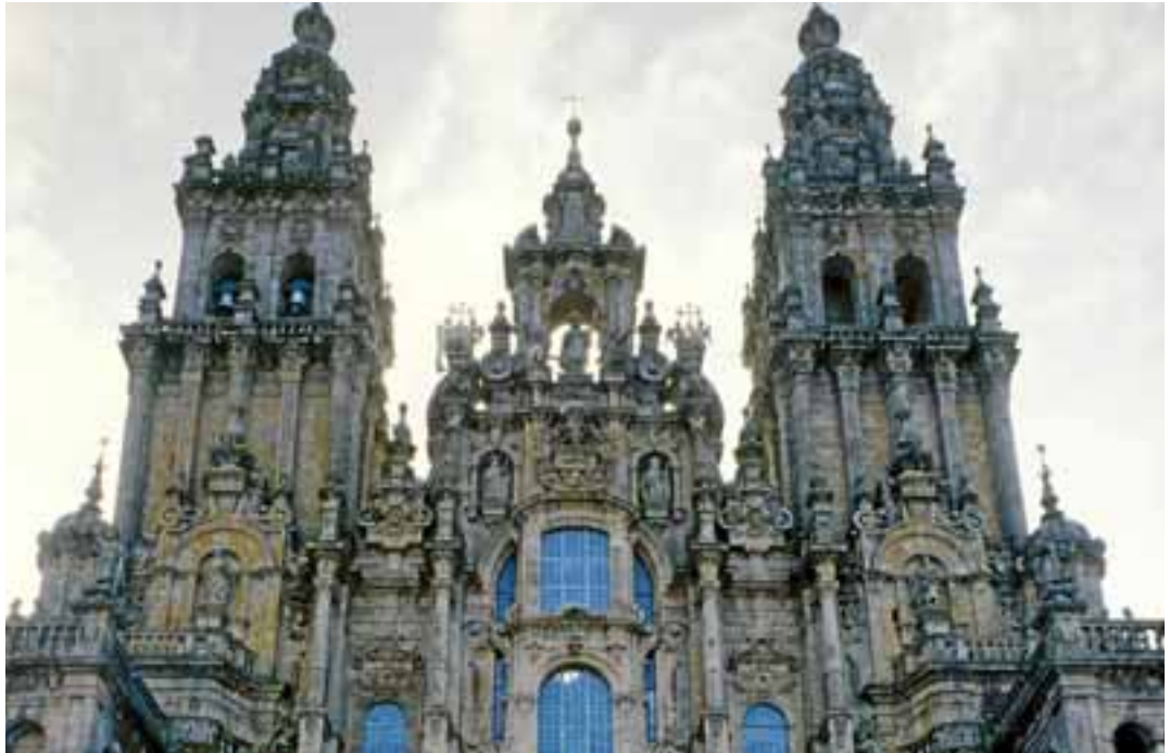
CATEDRAL Y FINAL. Es el culmen de todo el viaje. Ubicada en el mismo lugar en el que nació el bosque sagrado del fin del mundo. Cuenta con cinco fachadas destacan el Pórtico de La Gloria, de estilo románico, la Fachada Occidental de la catedral barroca y la Puerta Santa que este año se ha abierto por última vez.

El Apóstol Santiago tiene numerosas imágenes que definen los diferentes significados de su persona. Para algunos es uno de los 12 apóstoles de Jesús. Otros lo definen como el primer peregrino de todos y para muchos es como un guerrero capaz de luchar por su fe y de acabar con los moriscos, ya que en la Reconquista de la Península Ibérica tenía esta significación. Todos estas visiones del apóstol están presentes en la Plaza del