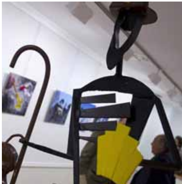
GALARDÓN INTERNACIONAL. La exposición inició en Burgos su largo recorrido que la llevará por diferentes lugares de toda España.

En el apartado de Fotografía se han premiado las tres propuestas