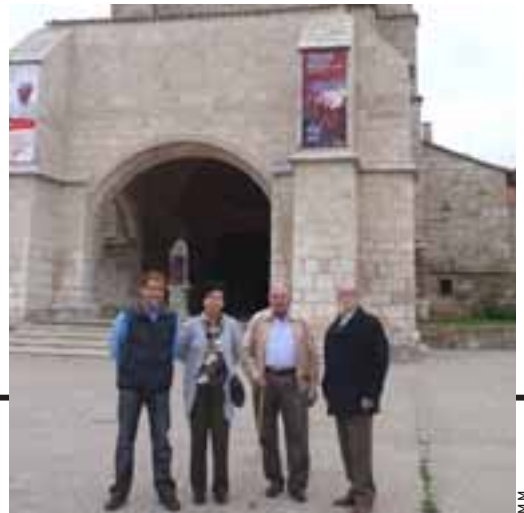
ESPERADA RESPUESTA. Ambos Consejos de barrio y la asociación Amigos del Camino ven así respondidas sus peticiones.

Mientras, Capiscol no se queda atrás en riqueza histórica, ya que el barrio fue -y es-, la entrada natural del antiguo Camino para aquellos que llegan desde el cercano pueblo de Castañares. Prueba de ello son los restos -que todavía pueden verse 'sobreviviendo' tras las edificaciones modernas que pueblan en la actualidad el barrio-, del que fuera uno de los hospitales más destacados del Camino a