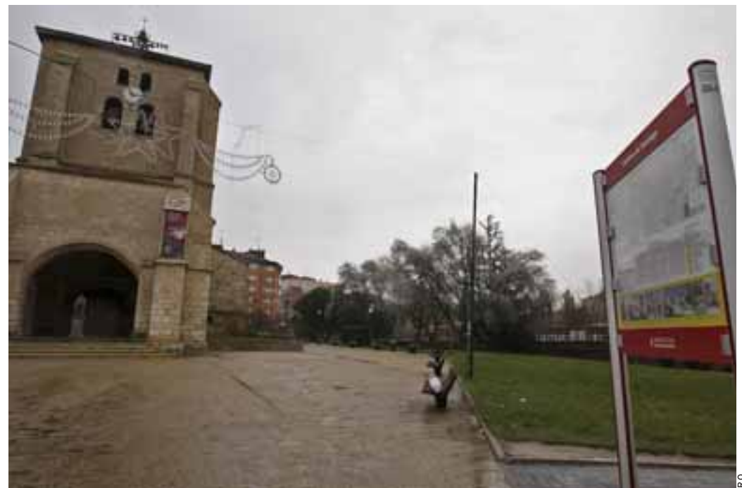
UNA DE LAS NUEVAS señales recalca la historia de la iglesia de la Real y Antigua y otra, el paso del Camino junto a la fuente del peregrino en Capiscol.