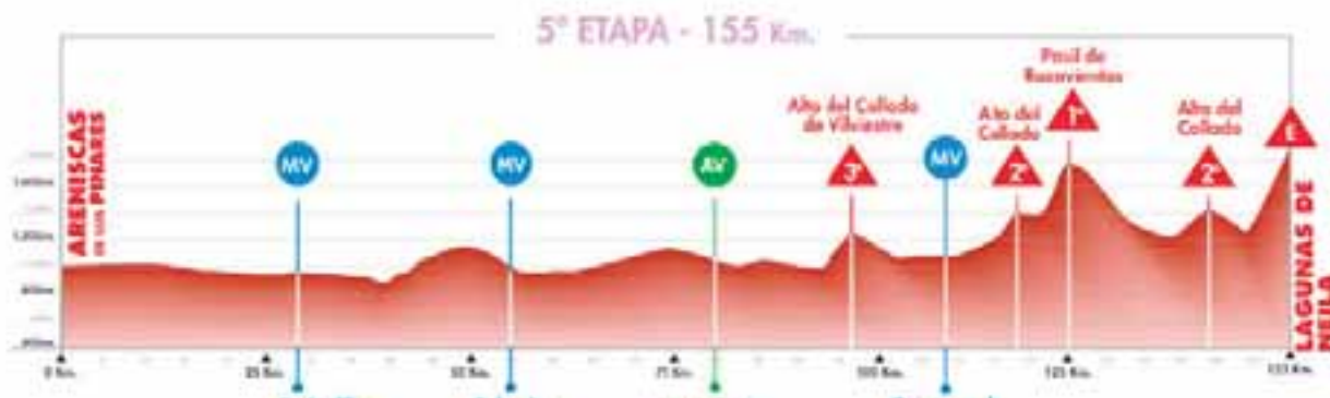
JORNADA REINA. La carrera se decidirá a buen seguro en las rampas de la mítica ascensión a Las Lagunas de Neila, donde cada año se agolpan en los arcones centenares de aficionados para seguir las evoluciones de los ciclistas.