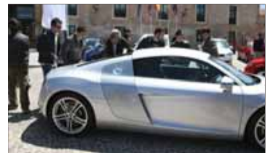
Imagen de la Feria de Automoción. / MIGUEL ÁNGEL

De este modo en algo más de 7.000 metros cuadrados, un total de seis concesionarios de Burgos y su provincia ofrecerán al visitante los modelos de las principales marcas como Audi, Ford,