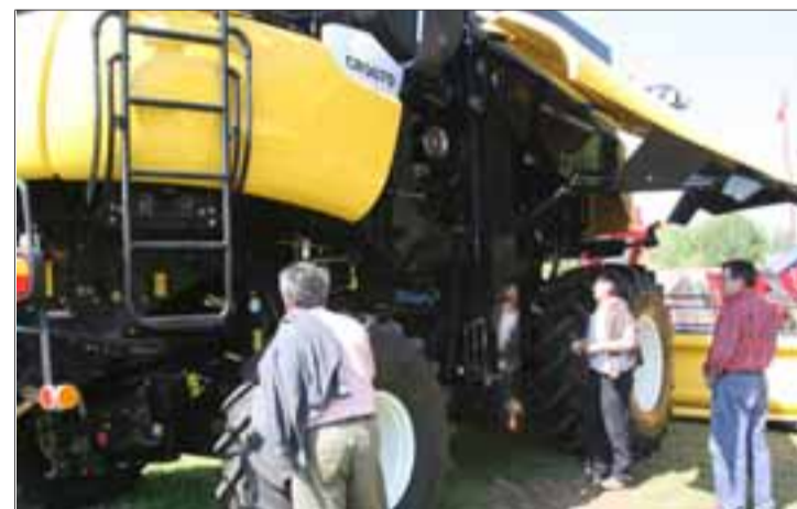
Una gran cosechadora en la muestra lermesa del año pasado.

Pese a todo y, en positivo, el sector agrícola es un sector estratégico, que está soportando mejor que otros el mal momento económico y que, además, ha de responder a un reto fundamental: el de la alimentación. El futuro de una agricultura competitiva, productiva, eficiente y sostenible, solo se puede entender a través de la tecnificación del medio agrícola y esto solo es posible gracias a los tractores y la maquinaria agrícola.