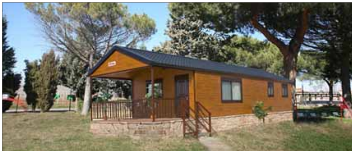
Uno de los modelos con porche de casas prefabricadas que ofrece Lercasa.

Y entre los aspectos positivos de este tipo de viviendas figura que en su adquisición se contem-