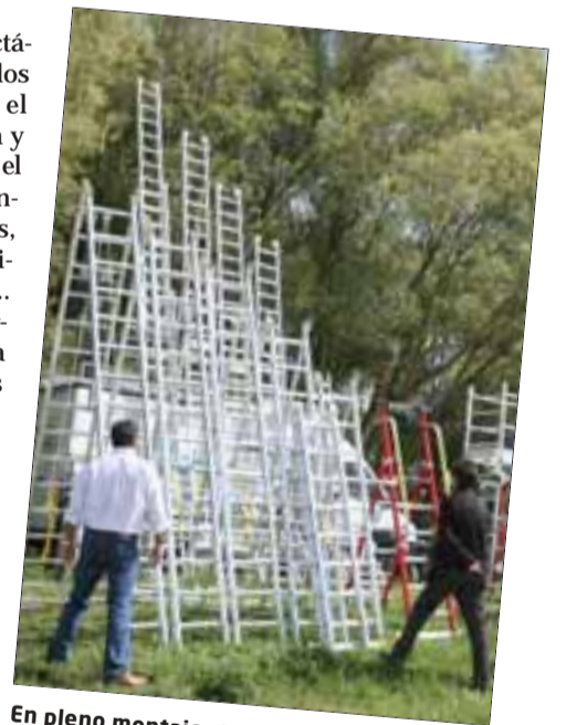
En pleno montaje. / MIGUEL ÁNGEL