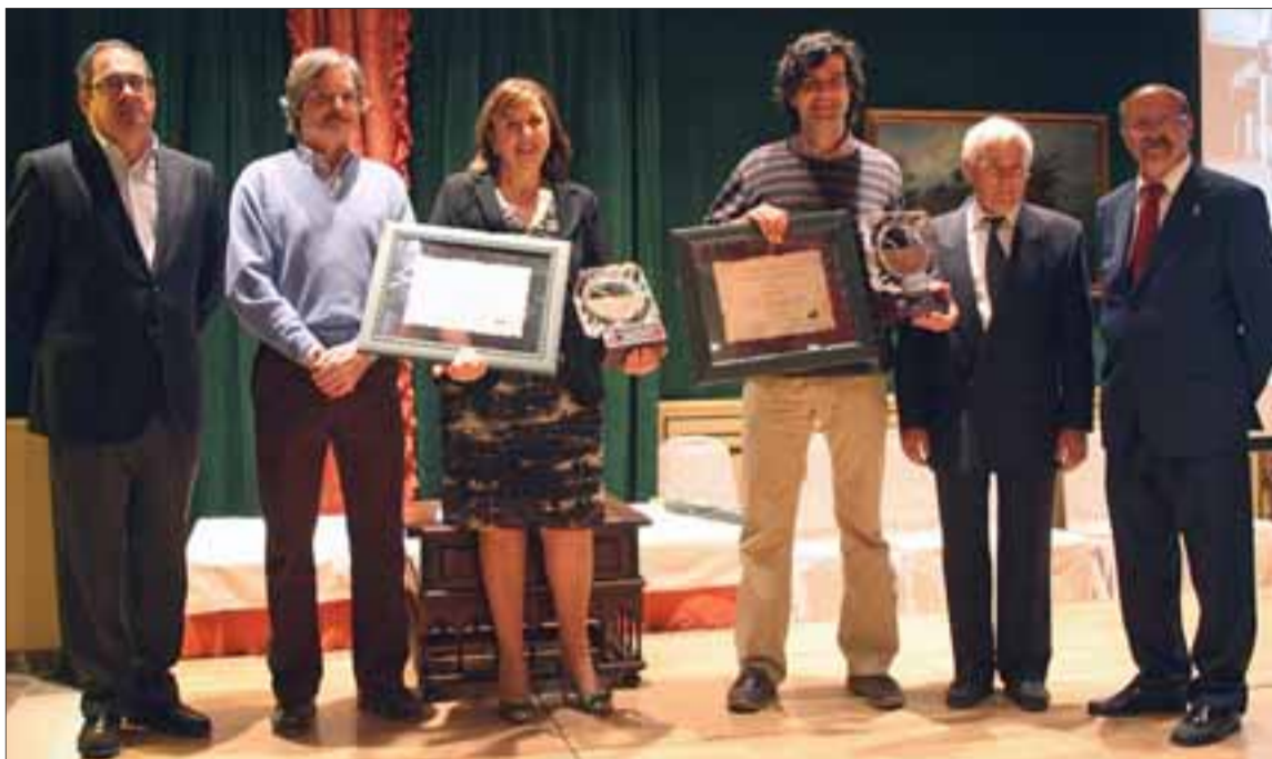
Los galardonados en la pasada edición de los premios que se entregan el día de la inauguración de la feria.