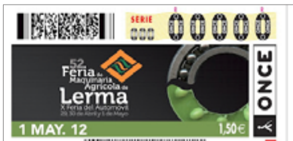
La Feria de Lerma protagoniza el 1 de mayo el cupón de la ONCE.

30 firmas acuden como cada año a esta Feria Agroalimentaria que se convierte en un abanico amplio de productos artesanos de distintas comunidades españolas como La Rioja, Asturias, Cantabria, Galicia, Navarra, La Rioja, País Vas-