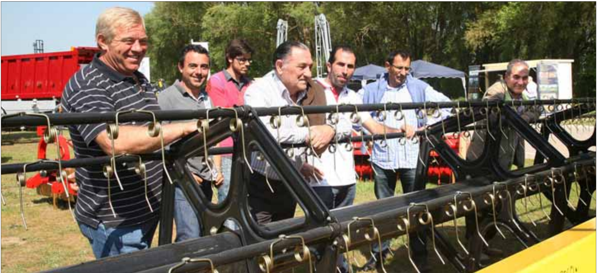
Los expositores y la maquinaria agrícola quedaban preparados en la tarde de ayer ocupando su lugar a la espera de que hoy abra la Feria una nueva edición, la número 52.

Un referente nacional que presenta novedades