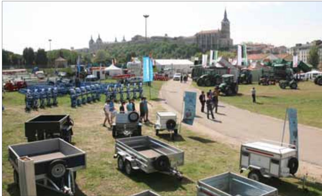
La Feria puede ser el pretexto para descubrir el rico patrimonio histórico y cultural que alberga Lerma.

Esto es lógico sabiendo que la industrialización ha dado un giro de 180 grados al trabajo de los agricultores. Conscientes de ello muchos profesionales del campo se acercan hasta la feria para comprobar 'in situ' las mejoras de la tecnología agraria.