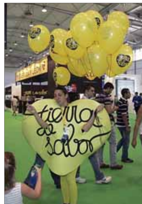
Tierra de Sabor está presente en todas las ferias.

La consejera aprovechó la nueva reunión del viernes de la Mesa Regional del Vacuno de Leche para dar a conocer al sector la evolución que este producto ha experimentado en el mercado y la acogida por parte de los consumidores de la Comunidad. «Del mismo modo que el lanzamiento de este nuevo producto lácteo contó con las sugerencias y la aprobación de sus miembros, hemos querido que sea el sector el primero en conocer los primeros y positivos datos desde su lanzamiento, de los que todos somos partícipes», significó.