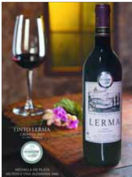
El Tinto Lerma crianza ha cosechado premios.

muy buena, sana y de buena graduación, en torno a los 12,5 y 13 grados en los primeros mostos y 14 grados en días sucesivos. Las