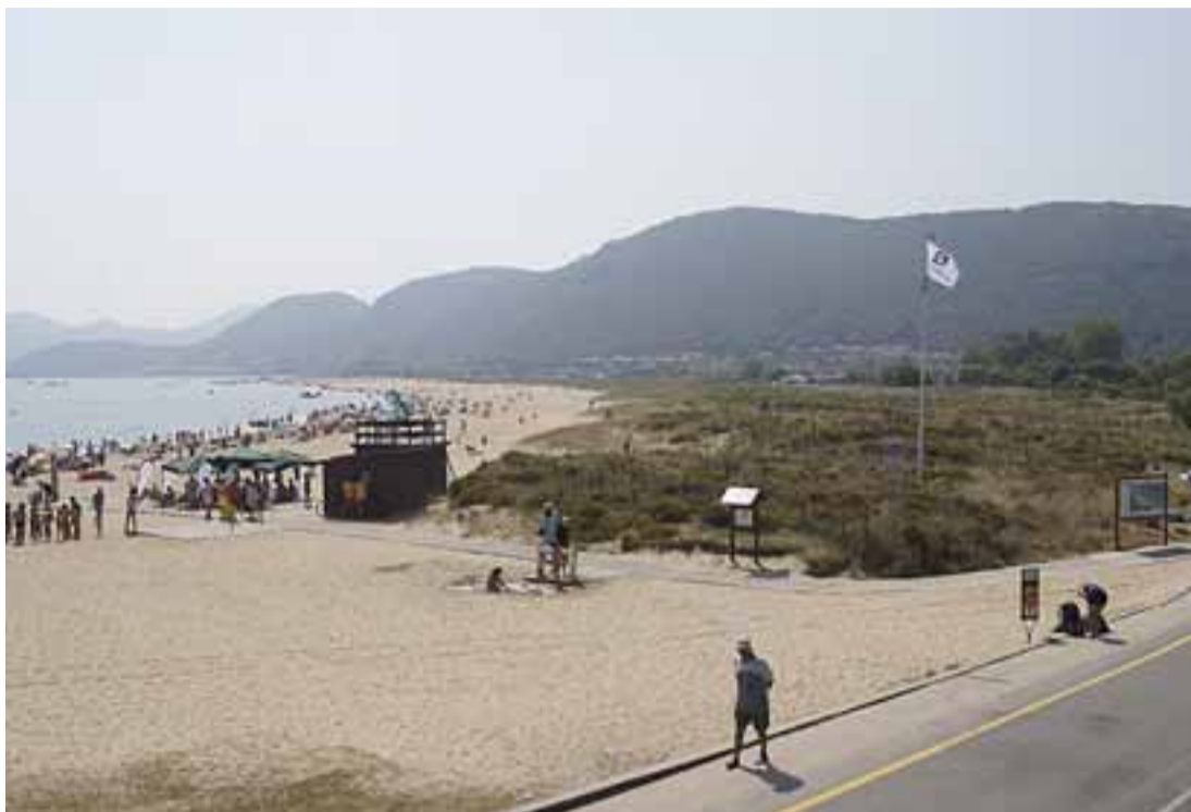
NOJA. Sus playas invitan al paseo. En la bajamar unen sus orillas y el turista tiene ante sí más de cinco kilómetros de fina arena. Las playas de Trengandín y Ris cuentan la 'Q' de Calidad Turística, tanto por sus servicios como por la calidad de sus aguas. Un paraíso natural al abrigo de las montañas que hacen de Noja el destino turístico perfecto.

En la marisma Victoria, perteneciente al Parque Natural de las marismas de Santoña, Victoria y Joyel, se han asentado las bases de una infraestructura básica para la práctica del turismo ornitológico. A sus orillas, en el Paseo del Brusco entre el campo de fútbol y el 'puente romano' de Helgueras, está instalado el Observatorio de Aves, una torre de siete metros de altura y una visión de 360°, que permite contemplar el millar de aves de 50 especies diferentes que habitan de forma regular el humedal entre las que se encuentran aves acuáticas como el ánade azulón, la cerceta común, el friso europeo, el porrón europeo y la garza