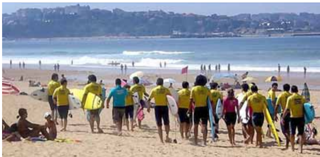
SOMO. La playa, al igual que en las de Suances, conviven en armonía surfistas y bañistas. Al fondo vista de Santander con el Casino y el Palacio de la Magdalena presidiendo el monte donde se asientan.

que reúne en Suances a los mejores surfistas tanto nacionales como internacionales.