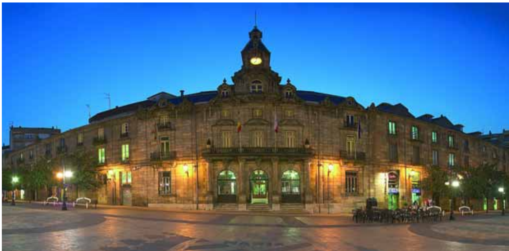
Vista nocturna del Ayuntamiento de Torrelavega.