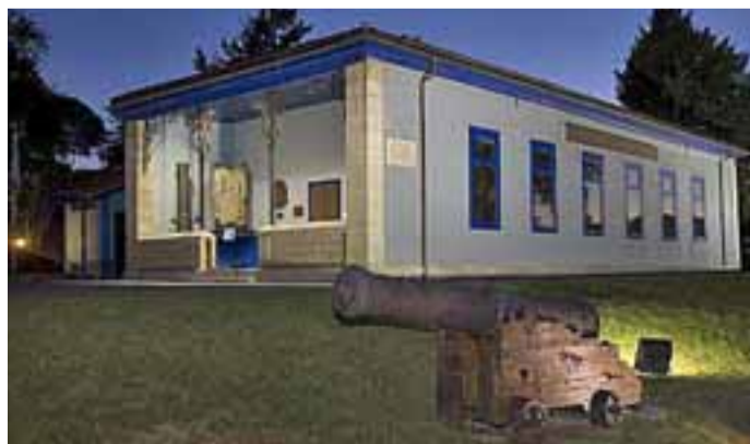
Vista exterior del museo con una reproducción de un cañón en primer término.