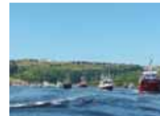
SUANCES. Procesión marítima en día 16 de julio en honor a la patrona de los hombres del mar, la Virgen del Carmen.

En el caso de Suances, cada 16 de julio, la villa se viste con sus mejores galas. La festividad congrega a miles de personas en el municipio pues la festividad de El Carmen en Suances fue declarada de Interés Turístico Regional en 2010 por «sus valores culturales y tradicionales y su contribu-