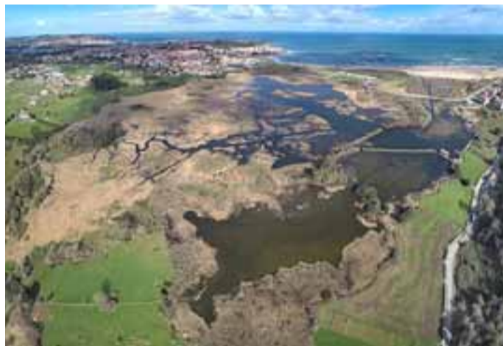
NOJA. Vista aérea de la villa donde se puede apreciar el núcleo urbano que se asoma al mar, las marismas y su alto valor paisajístico y natural.

Además de que Noja presenta amplias posibilidades de disfrutar de su entorno natural, no hay que olvidarse de su gran oferta veraniega. Cultura, música y deporte serán los protagonistas del verano en la villa. Para todos los gustos y sin salir del municipio, el turista puede deleitarse con la práctica de cualquier deporte, especialmente los acuáticos, o de la cultura con una nueva edición del simposio de arte Sianoja, el IV Campus Musical o los cursos de verano de la Universidad de Cantabria de especialidad musical que acoge el Palacio Marqués de Albaicín. Además, esta casa palaciega reconstruida en el siglo XIX puede visitarse en los meses estivales y alberga activi-