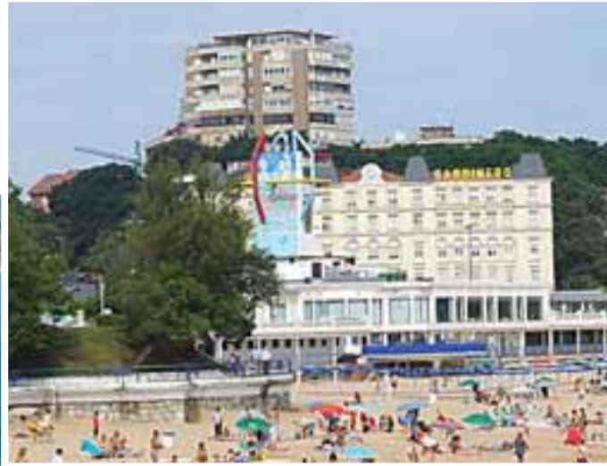
EL SARDINERO. La playa de El Sardinero, en plena ciudad, es uno de los reclamos más turísticos de la capital cántabra y a la que acuden miles de turistas cada verano.