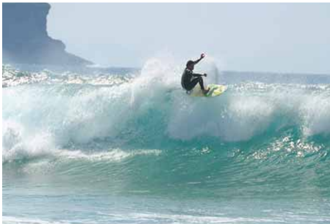
SUANCES. Las playas de Suances son un reclamo turístico de primer orden, pero en Los Locos, los surfistas encuentran el paraíso para deslizarse sobre los rompientes de las olas.