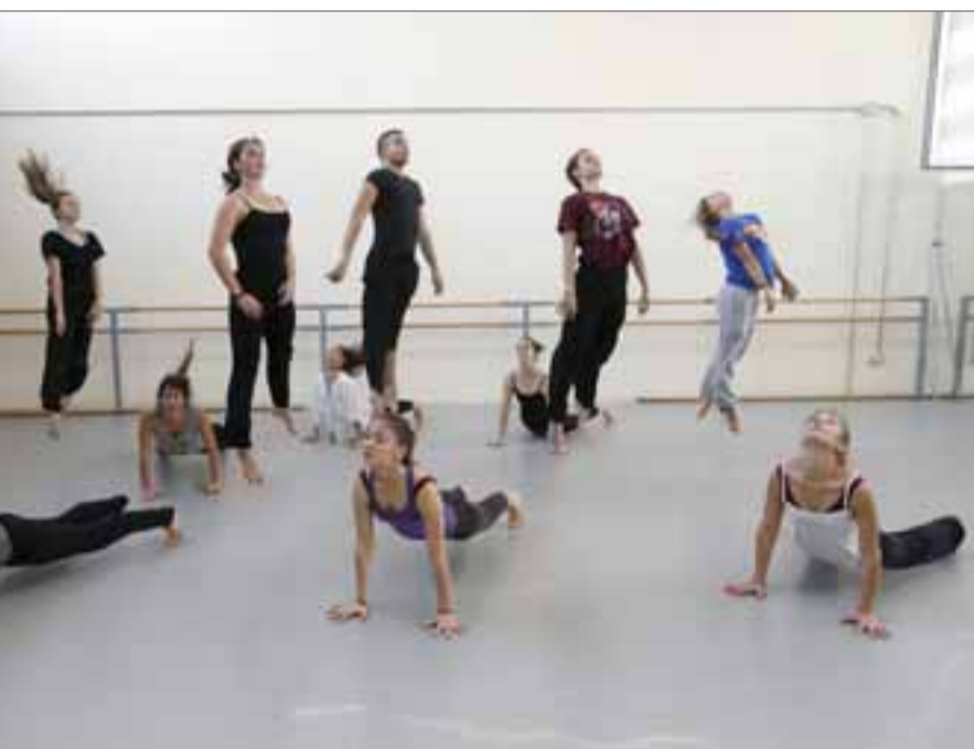
Los bailarines de Contemporáneo destacan la libertad que permite esta especialidad.