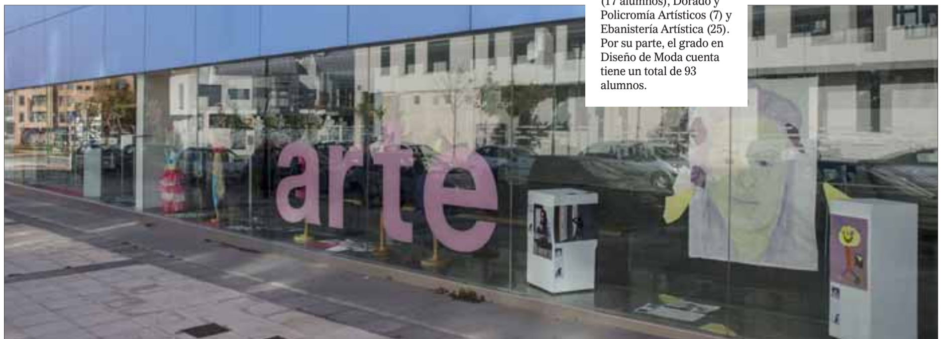
La Escuela de Arte y Superior de Diseño de Moda se encuentra en la calle Sahagún. SANTI OTERO

Desde la dirección están abiertos a que la escuela pueda acoger nuevas especialidades de estudios de diseño, igual que ahora tienen diseño de moda, con la idea de optimizar los recursos que ya tiene el centro. La jefa de estudios asegura que esta petición la realizan sobre la base de que, en los últimos cursos, son la escuela con más demanda de plazas en el primer curso de diseño de toda Castilla y León. El primer año es común en todos los grados y luego en segundo curso algunos alumnos se desplazan a otras provincias donde actualmente se ofertan otras modalidades. Desde la escuela burgalesa, consideran que por su experiencia podrían acoger diseño gráfico, de producto o de mobiliario.