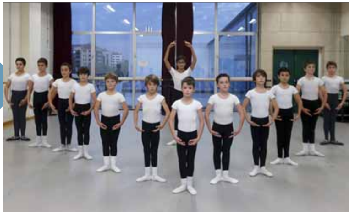
Cada vez son más los niños, de sexo masculino, que hacen caso omiso a los prejuicios y tocan a las puertas del centro.