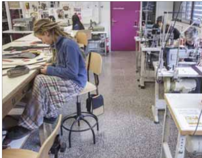
Una estudiante dibuja en una de las aulas de Diseño de Moda.

Las enseñanzas artísticas superiores de Diseño de Moda son grado universitario.