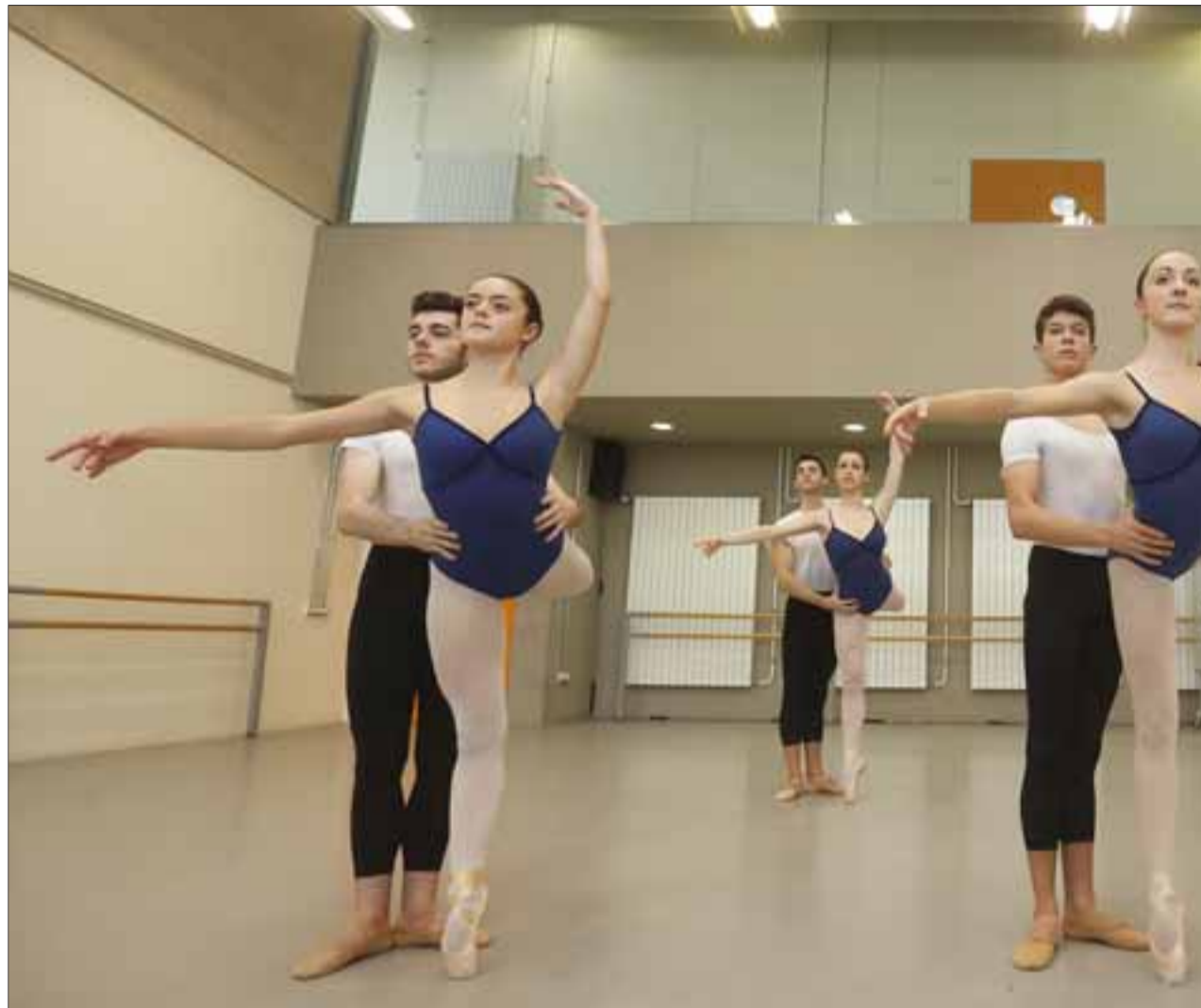
La modalidad de Clásico exige disciplina, rigor y entrega a quienes eligen su camino.

El económico tampoco es un problema. Santamaría afirma que