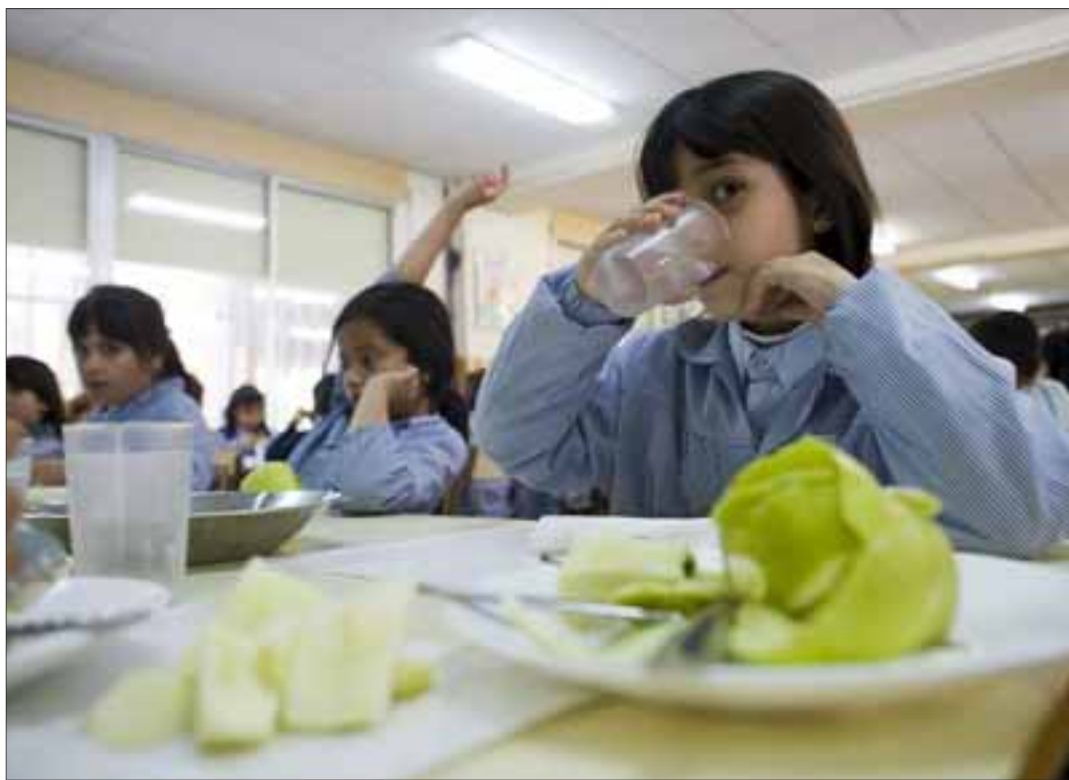
Uno de los comedores escolares de un centro docente de Burgos.

Además se busca acentuar e intensificar la información a las familias. Todo ello en pro de la mejora de la calidad nutricional y sanitaria de los comedores escolares de la región.