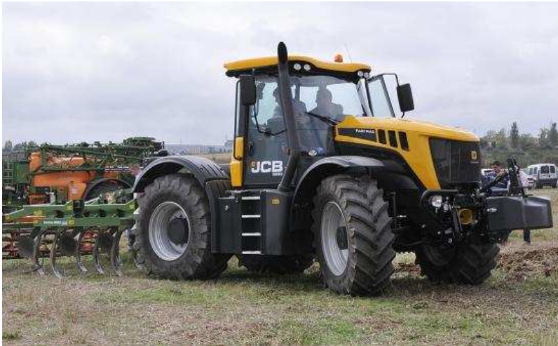
Maquinaria agrícola.