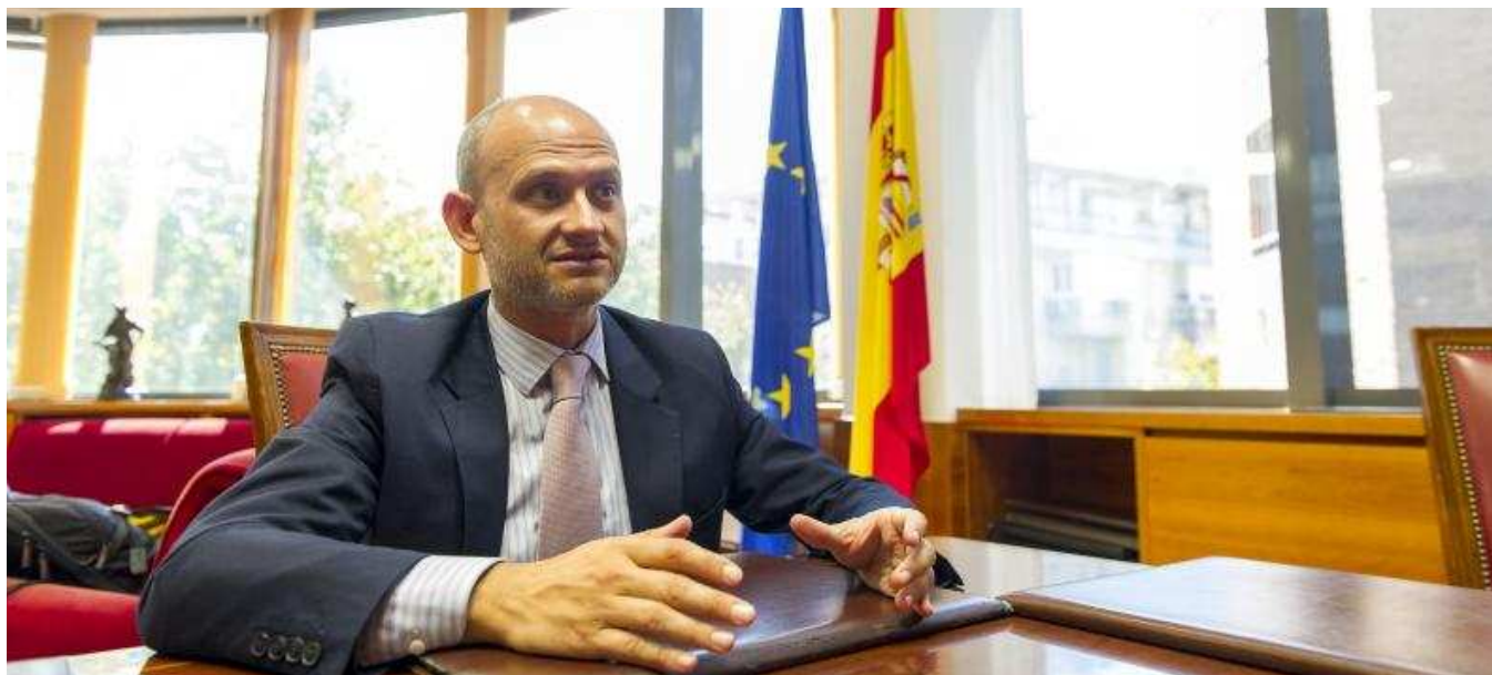
El director de la Agencia de Información y Control Alimentarios en la sede del AICA en Madrid.

Feria del Acebo en Oncala y Jornadas del Cardo Rojo en Ágreda PÁGINA 8