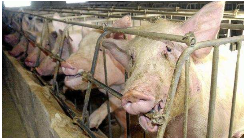
Castilla y León es refugio de pequeños productores aunque cuenta con conocimiento y materia prima.