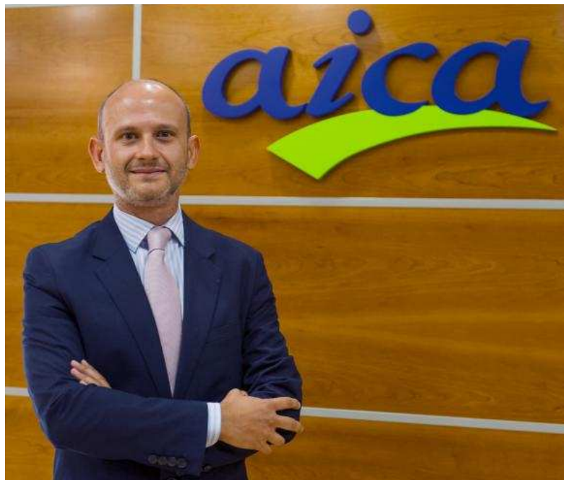
La Agencia se creó por la Ley de la Cadena en agosto de 2013 y tiene personalidad jurídica propia.

R.- Varios. El primero, que se cumpla la Ley de la Cadena sin necesidad de tener que multar. Y esto se basa en una política de comunicación para explicar las ventajas de la Ley. Todos los operadores deben comprometerse en dar a conocer las nuevas reglas de juego. Prefiero que nos cuenten el problema a tener que intervenir. El reto es que la Ley sea conocida y se aplique. Cuando haya que actuar, hay que ser eficientes y ágiles en esas actuaciones, y profesionales y rigurosos en el procedimiento sancionador.