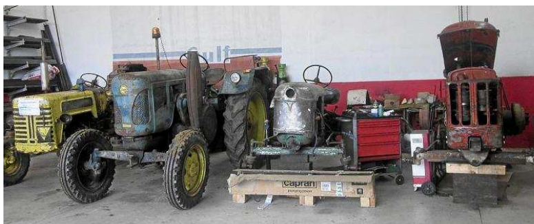
Algunos de los vehículos actualmente en restauración. Abajo, Domingo Martín con un CASE del año 32.