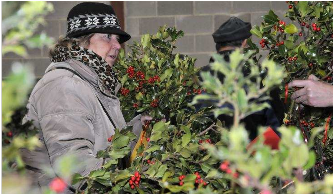
Una imagen de la popular Feria del Acebo de Oncala.

Apicultores, cooperativas y consumidores han trasladado al Ministerio de Agricultura la necesidad de que la miel cuenta con un etiquetado de origen