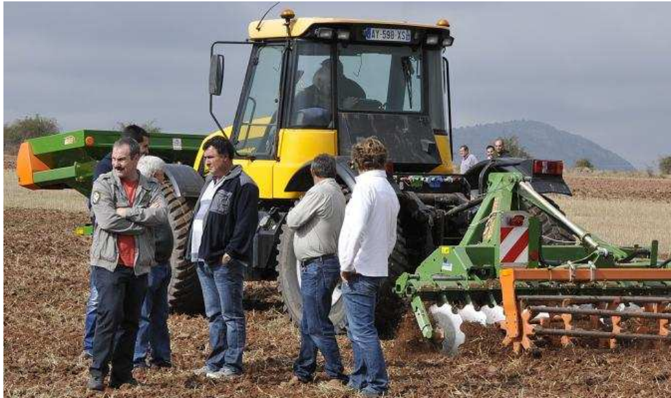
Labores en una explotación de Soria.