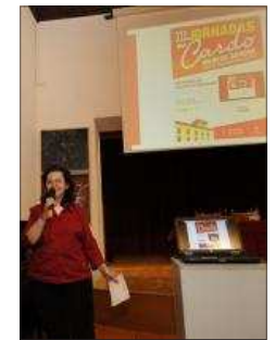
Jornadas del Carco Rojo.

Ágreda celebra desde mañana viernes y hasta el próximo miércoles las VI Jornadas del Carco Rojo, que incluyen un amplio programa de actividades. Mañana viernes a las 19 horas tendrá lugar la inauguración de exposiciones en el Palacio de los Castejón y la apertura de las jornadas con la conferencia 'Carco Rojo, pasión en tu mesa', de Lorezo Gómez Mora. El sábado el programa incluye campeonato de azada, visita guiada por las Huertas Árabes, Concurso Na-