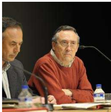
Uno de los grupos ecologistas.