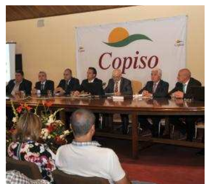
La empresa Copiso.

ses. Según Gómez, como ejemplo, «los ecologistas han forzado a la Unión Europea a establecer unos cuidados para el suelo, evitando que se quemara la paja y obligando a picarla, una tarea muy costosa para el agricultor, pero por ello ahora no hay refugios para las aves que ellos mismos reclaman». Para Asaja, hay muchas contradicciones.