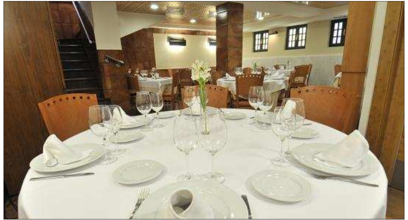
La mítica barra del Ventorro y el comedor del establecimiento. VALENTÍN GUISANDE