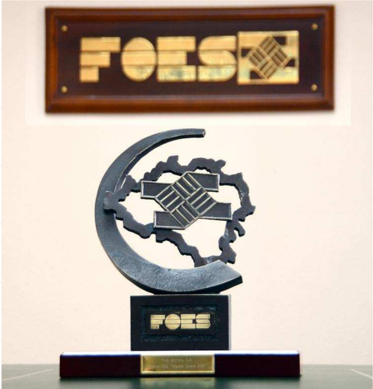
Uno de los premios que entregará FOES a empresas y empresarios de la provincia que destacaron durante el año 2015. ÁLVARO MARTÍNEZ

XXIII EDICIÓN DE LOS GALARDONES EMPRESARIALES DE LA PROVINCIA