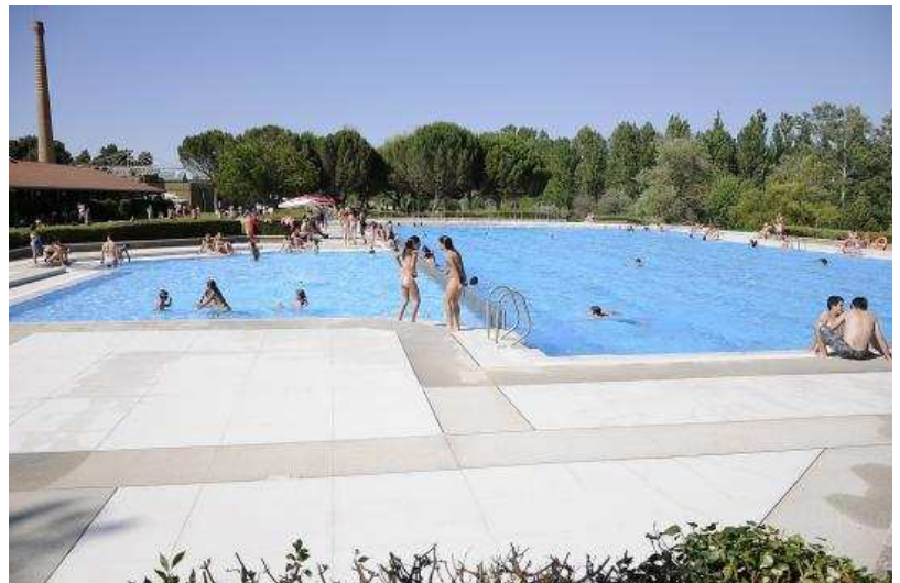
Las piscinas de Almazán se ubican junto al parque de la Arboleda.

Y para completar la oferta, el quisco de helados, snacks y golosinas y el bar-restaurant, que ya es todo un referente en Almazán. Dispone de una amplia terraza en la que los usuarios pueden comer para completar un día perfecto de verano. El restaurante ofrece almuerzos y menús diarios y a la carta a precios muy asequibles y para todos los bolsillos. Es conveniente realizar reservas, sobre todo los fi-