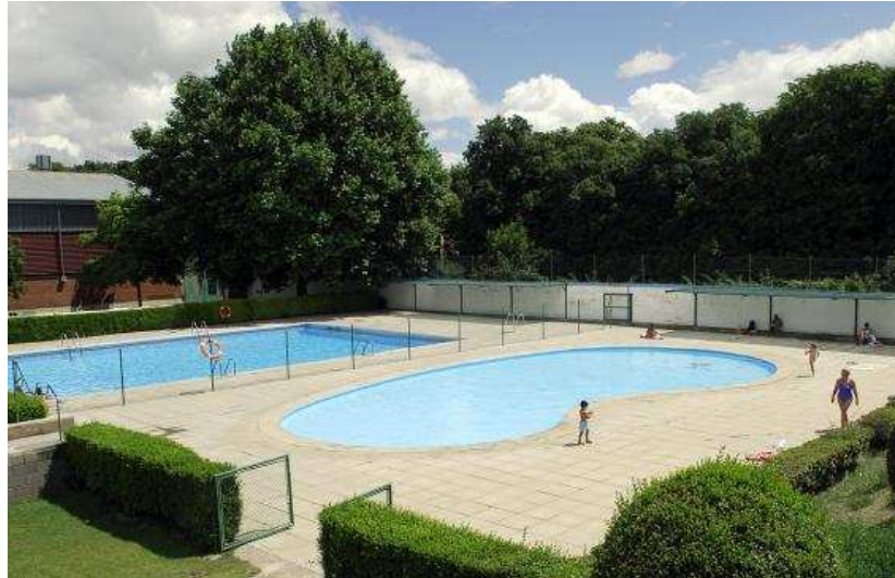
Panorámica de las piscinas municipales de Ágreda.

Hay zonas de sol y de sombra, arboladas, y también se pueden usar hamacas para una mayor comodidad del usuario. La zona