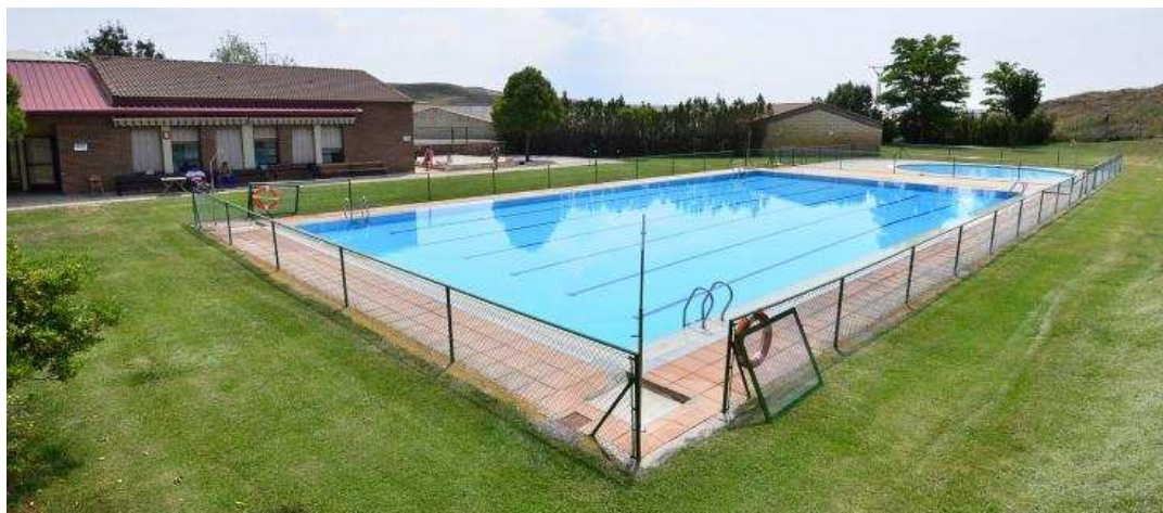
Una vista del complejo de piscinas de verano de Gómara.

Las piscinas de Almenar son una gran opción para los que busquen aprovechar una jornada de verano de una forma tranquila y cerca de la capital.