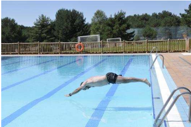
Una imagen de una de las piscinas del Camping El Concurso.

El complejo de piscinas de verano de este camping de 1ª Categoría cuenta con servicio de bar-restaurante,