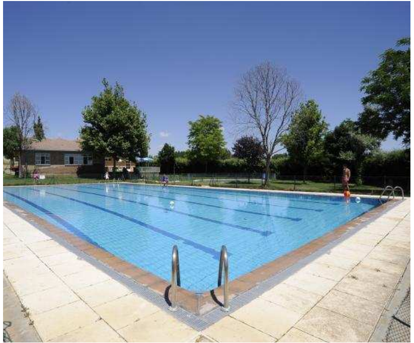
Las piscinas municipales de Almenar de Soria.

Igualmente, Almenar ofrece en sus piscinas municipales el servicio de bar-restaurante, en el que poder tomar un aperitivo e incluso comer y merendar. Hay ricas tapas, platos combinados, bocadillos y pizzas para degustar en la amplia terraza de