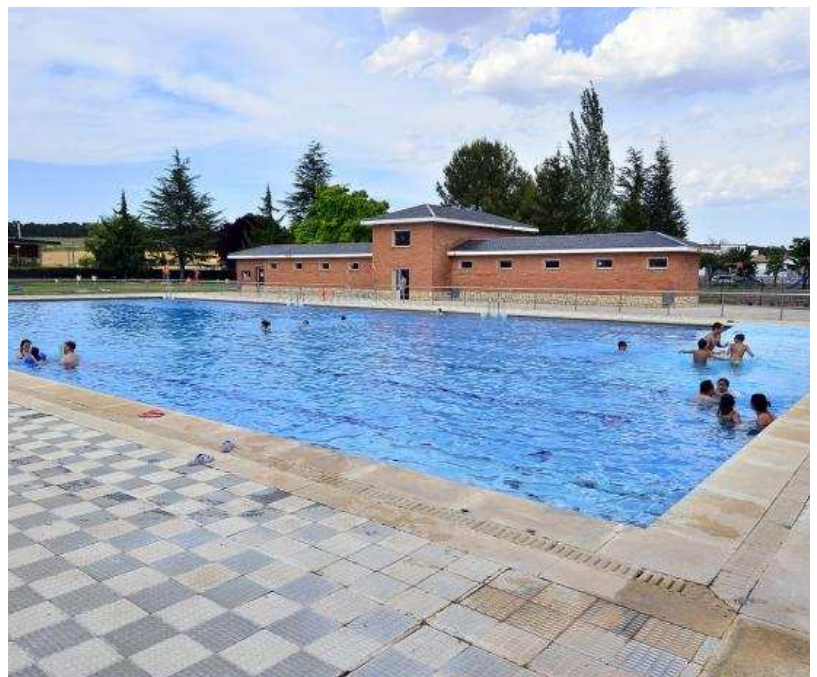
Las piscinas de Bayubas de Abajo son todo un referente en la provincia.

También hay en las instalaciones un bar-restaurante, en el que poder degustar almuerzos, comidas, cenas... Para grupos numerosos es mejor realizar el encargo unos días antes, con el fin de contar con espacio en el comedor interior o en la amplia terraza exterior. Hay menú diario y carta y este año la especiali-