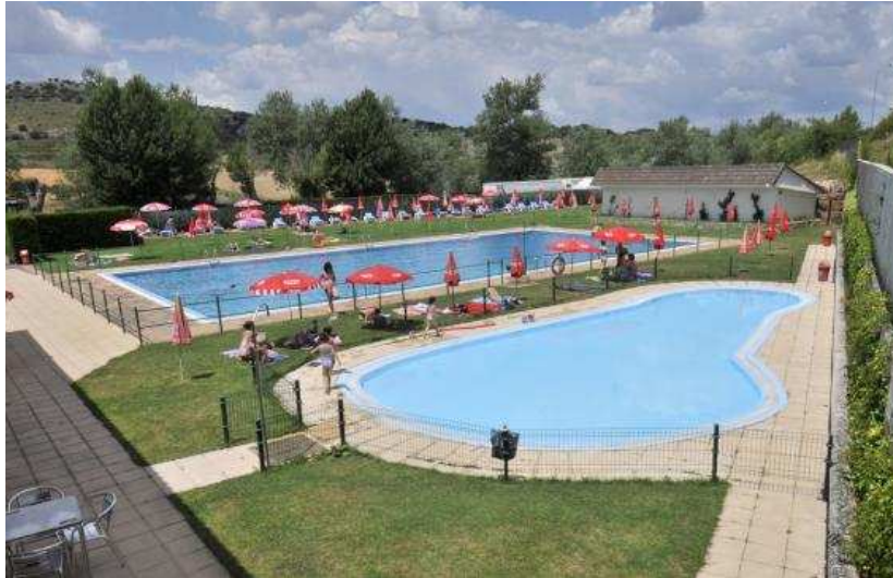
Vista de la piscina del Camping Fuente de la Teja, en Soria capital.

En el complejo encontramos un quisco de snacks, golosinas y helados. Pero el plato fuerte es el restaurante, con una amplia