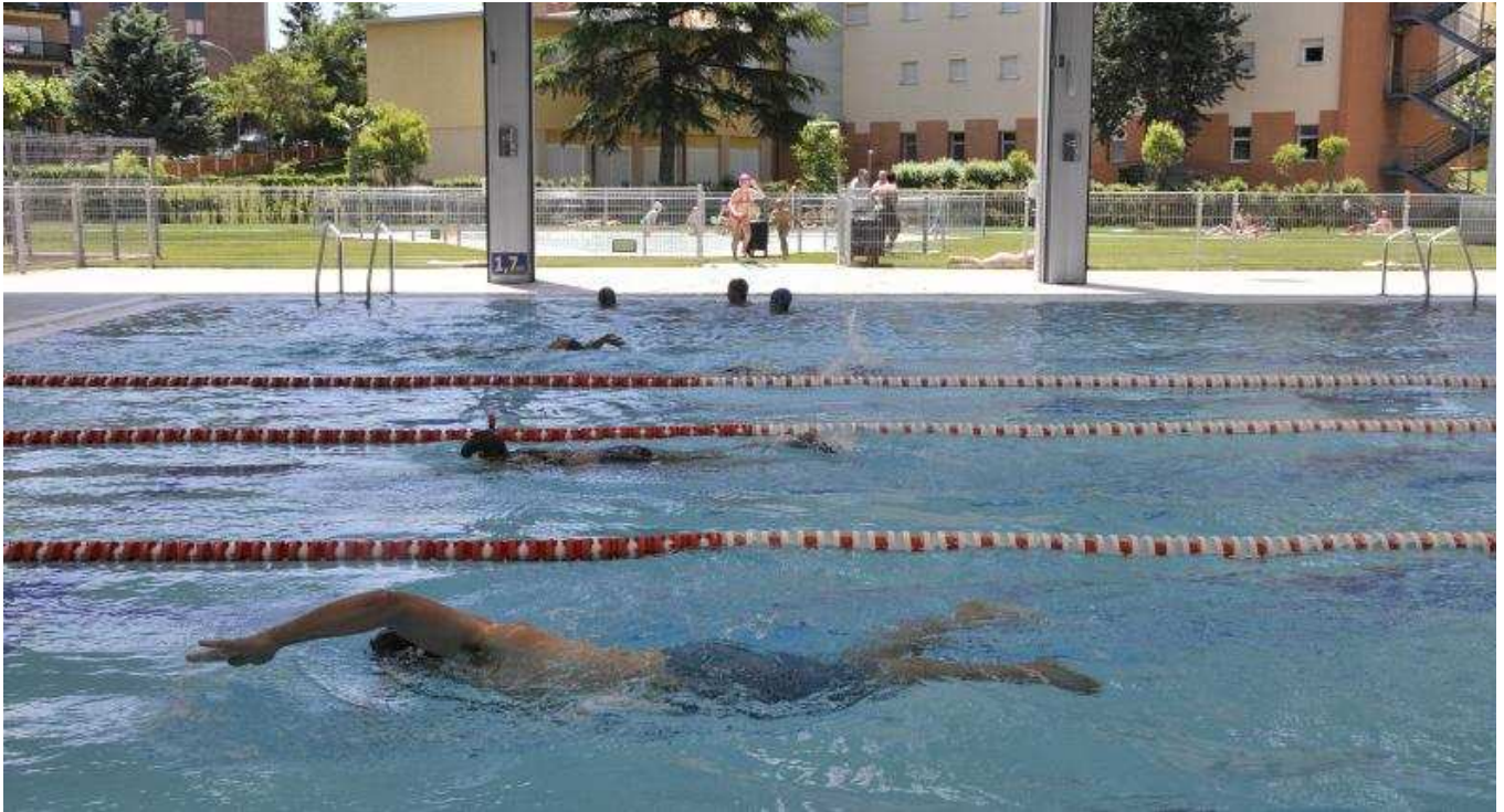
Las nuevas instalaciones de la piscina de la Juventud que conecta con el jardín exterior y la piscina de niños en los meses de verano.