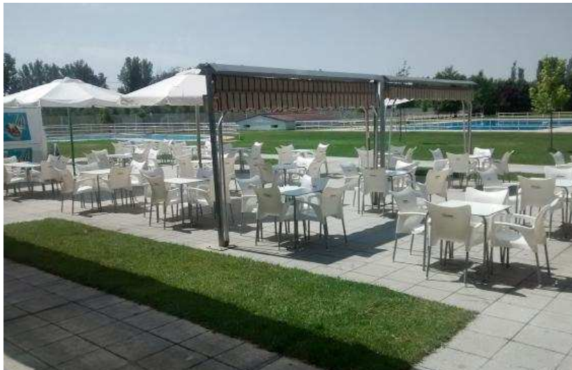
Una vista de las piscinas y las zonas deportivas desde la terraza del bar-restaurante.

Parece que el verano ya ha comenzado y el calor ha llegado a la provincia, por lo que sorianos y visitantes comienzan a acudir a las piscinas de verano. El complejo de Tardelcuende será una buena elección para darse un buen chapuzón y para practicar deporte, ya que junto a las piscinas encontramos zonas deportivas de tenis, padel, frontenis, fútbol, volei... Además, este complejo dispone de un inmejorable servicio de bar-restaurante en el que podemos optar por el menú del día entre semana y un menú especial