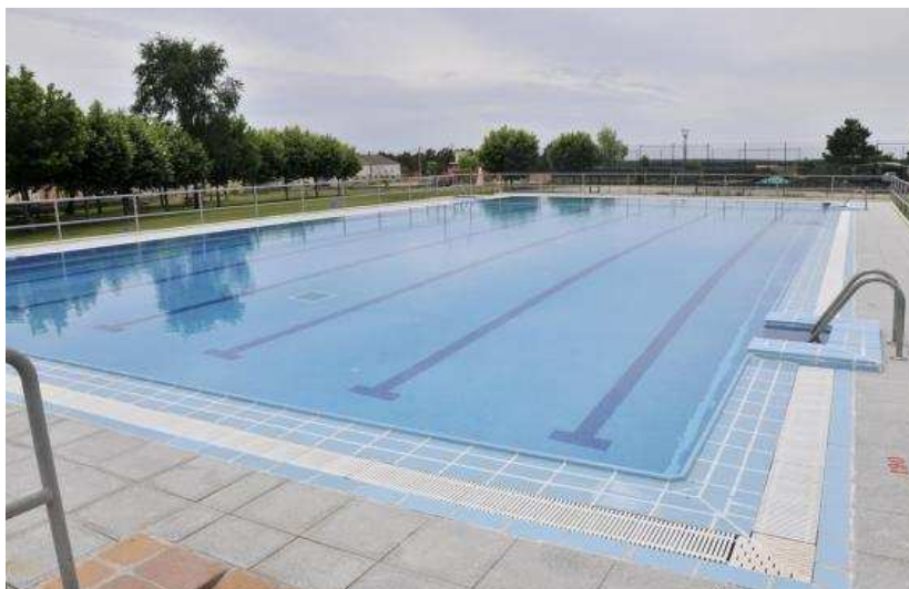
Una imagen del complejo de Quintana Redonda.

Y también tenemos que hablar del servicio de bar-restaurante, en el que se ofrecen comidas, raciones, bocadillos, menús... Tanto de encargo como para llevar. El menú de paella (ensalada, bebida, paella, postre y café por 12 euros) conviene encargarlo con antelación. Las piscinas son punto de encuentro para disfrutar del agua en una jornada calurosa y también para tomar el vermut o comer en grupos de familiares y amigos. También Quintana dispone de instalaciones deportivas ideales para la