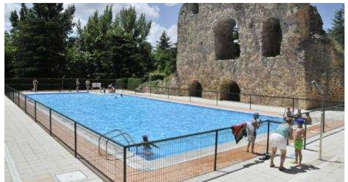
La piscina del Castillo es una gran opción para los niños este verano.