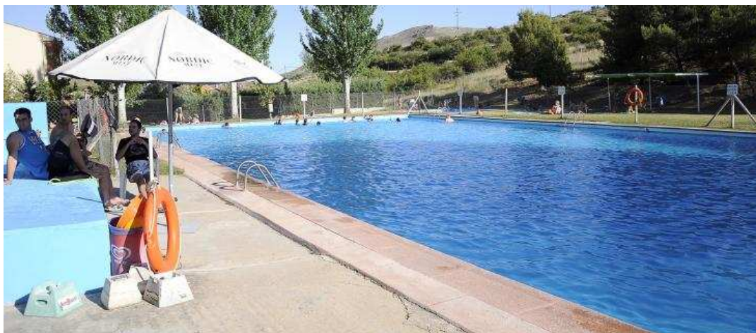
Las piscinas municipales de Mecinaceli, que son de las más veteranas de la provincia de Soria.

mida o la medienda. Las comidas son el principal reclamo, porque hay muchos bañistas que aprovechan la jornada de principio a fin y optan por quedarse a comer en las propias instalaciones. En ocasiones se organizan actividades para los más pequeños. La piscina de Ágreda es una gran opción para los vecinos de la zona e incluso para los de Soria que se acerquen hasta tierras del Moncayo.