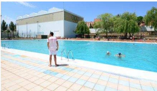
La piscina del San Andrés, de grandes dimensiones, también en el capital.