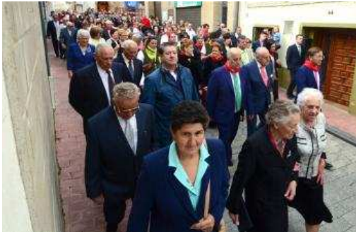
Los olveguños sacaron en procesión al patrón de la localidad.