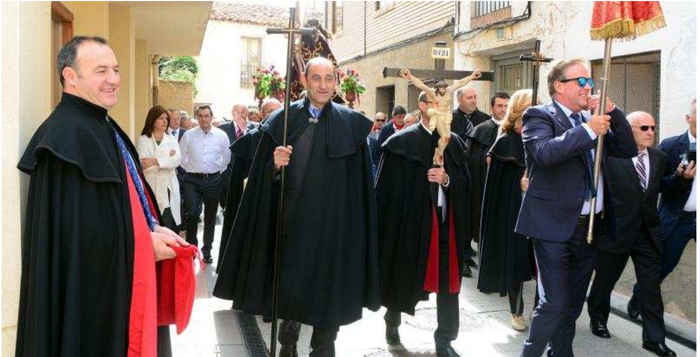
La procesión del Cristo, que precedió a la misa, fue uno de los actos principales de la jornada festiva de ayer en Ólvega.