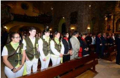
Gran ambiente festivo en honor al Cristo.

quintos y el concurso de recortadores con anillas, un espectáculo muy vistoso. El domingo acabarán las fiestas con la popular comida de la vaca, en la que se darán cita unos 2.300 comensales, según las previsiones del Ayuntamiento. Por ahora, no hay previsiones de lluvia, así que