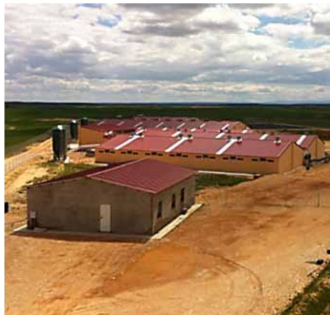
Explotación de Agropecuaria de Caleruega.