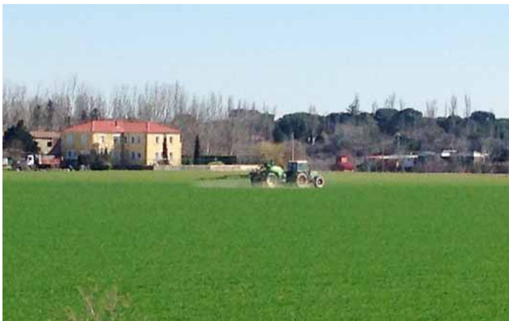
Los profesionales comienza los tratamientos en el cereal tras las lluvias.

De forma general, Montero insiste en que el maíz «no es un precedente recomendable» en la rotación, por ser huésped de la rhizoctonia. Igualmente se aconseja precaución con los herbicidas residuales que ha-