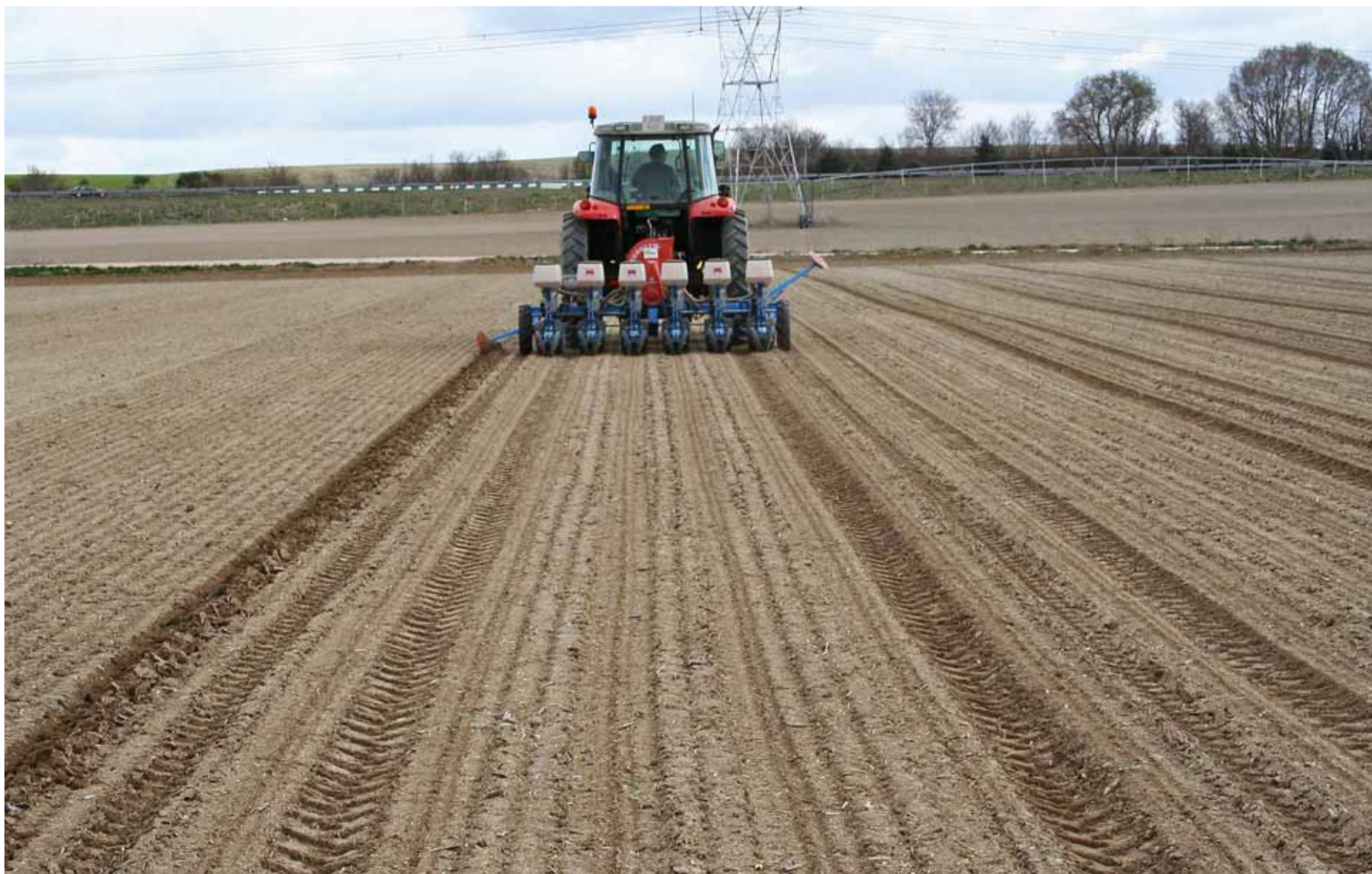
Un agricultor realizando labores de siembra de remolacha en una parcela de Castilla y León.