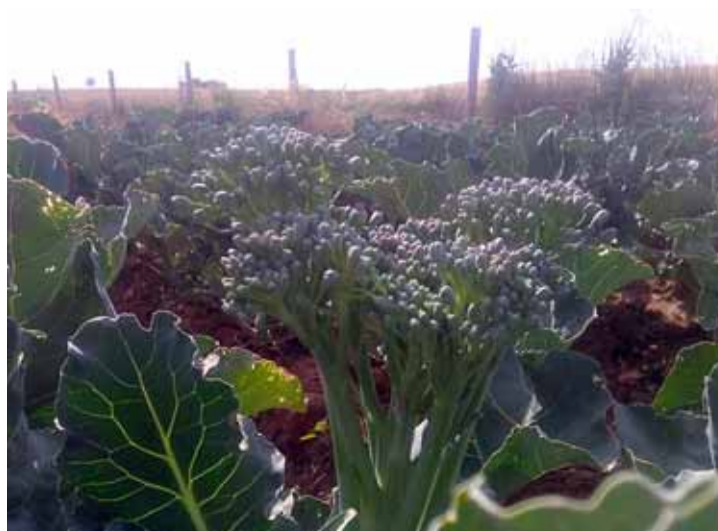
Una imagen de la plantación de bimi en el Canal de Almazán.