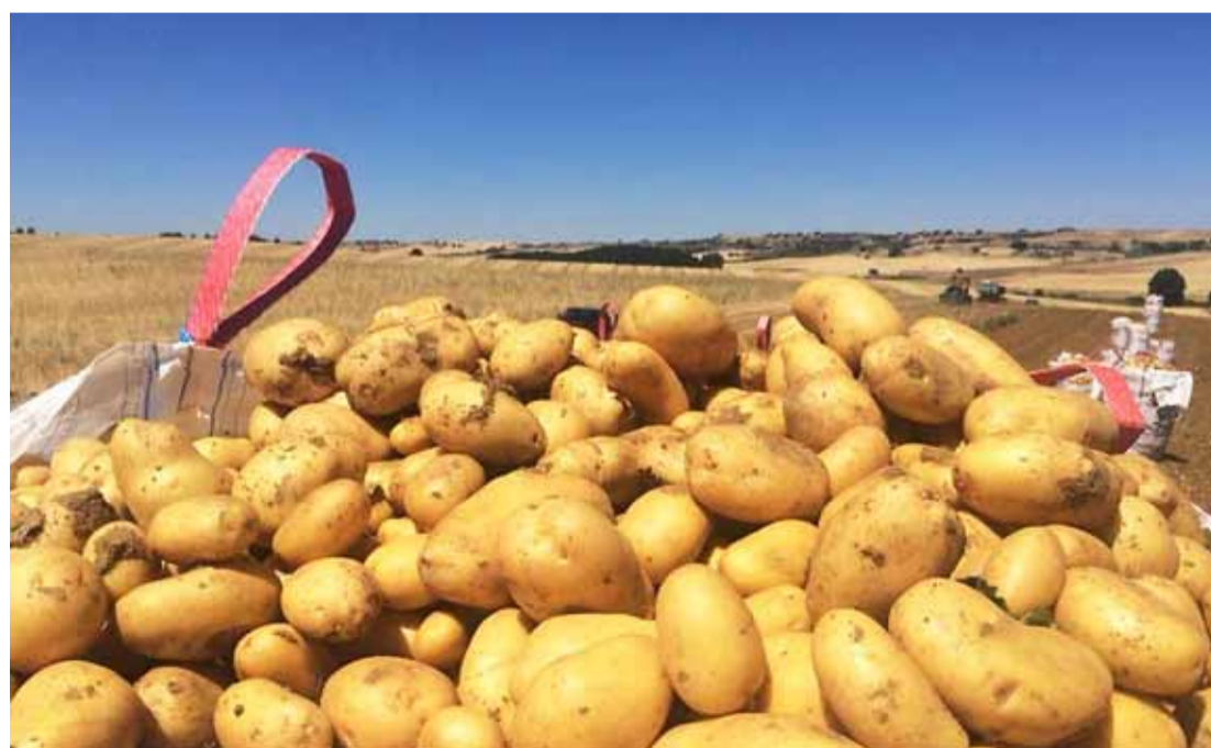
Saco de patatas en la cosecha de la última campaña en una parcela de Valladolid.

Los casos de 'pulguilla de la patata' registrados en Galicia están circunscritos, según Medina, a zonas de huertos para consumo local, lo que hace más difícil su ex-