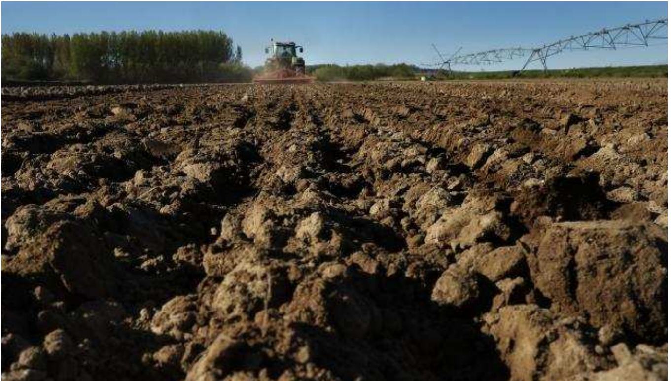
Un trabajador realiza distintas labores agrarias con su tractor en una parcela de la Comunidad.

El régimen de pago básico se ha regionalizado desde 2015, lo que quiere decir que cada derecho de pago básico solo puede activarse en la región en la que se asignó dicho derecho. Las regiones se basan en las utilizaciones declaradas en el año 2013, pero de cara a las declaraciones del nuevo periodo no están vinculadas a ningún tipo de producción específica.