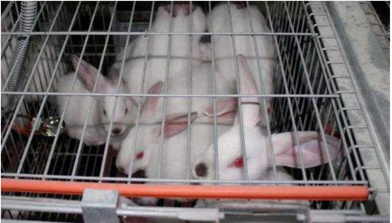
Animales bajo el sistema de cría en jaulas en una granja de la Comunidad, un sistema que Europa aboga por eliminar progresivamente.