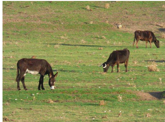
Un burro en una explotación de vacuno del proyecto de Aszal.

El secretario de Aszal explica que en las explotaciones en las que se ha llevado a cabo el proyecto se han introducido animales individuales. Y es que el uso de varios burros en un mismo rebaño «no es recomendable» ya que tienden a permanecer juntos y esto puede descuidar el contacto con el ganado. Las cuatro explotaciones testadas donde se han integrado seis animales son todas de vacuno, aunque el proyecto es también útil para ovino. En este sentido, De Gabriel apunta como el perfil idóneo para este proyecto lotes de ganado de menos de 50 cabezas. Los