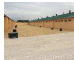
Naves ganaderas de Soria.

La Junta encuadra este nuevo sistema en el Programa de Desarrollo Rural y se podrán garanti-