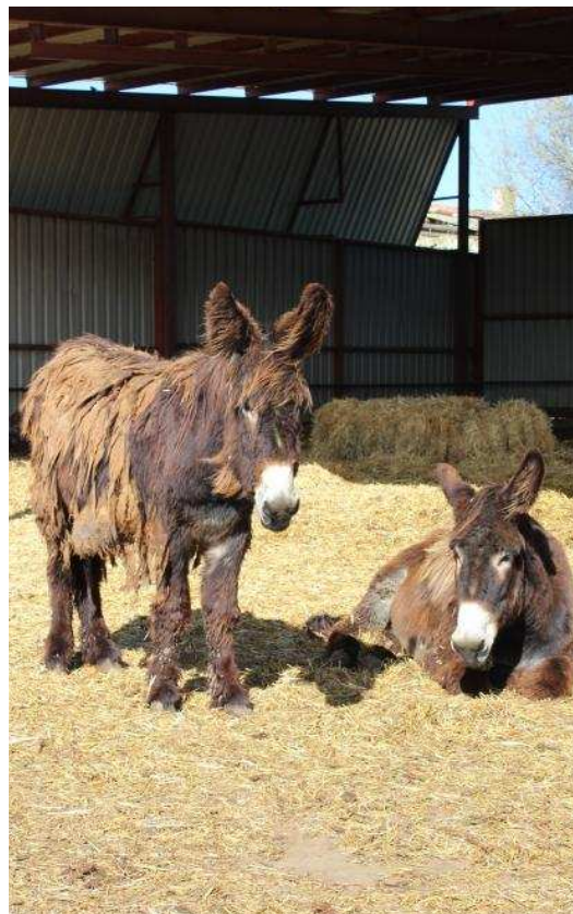
Ejemplares de la raza zamorano-leonesa con su pelo largo y lana característica.

Tras el desuso de los asnos en la actividad agraria, Aszal trabaja en nuevas estrategias para velar por su pureza, selección y fomento. De esta forma, el burro zamorano-leonés encuentra nuevos usos en la actualidad como la producción de garañones para procrear; la asi-