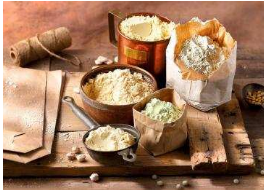
Las harinas de pseudocereales y legumbres cobran fuerza.

Las legumbres pueden ser una alternativa por sus cualidades nutricionales, ya que no contienen gluten. El garbanzo, la soja o la lenteja se transforman en harinas con gran contenido en proteínas, fibra, vitaminas del grupo B y minerales como el hierro y el magnesio. Los panes elaborados con este tipo de harinas «tienen una textura suave, esponjosa y, en algunos casos, como el de los elaborados con harina de garbanzo, tienen un intenso sabor», indican des-