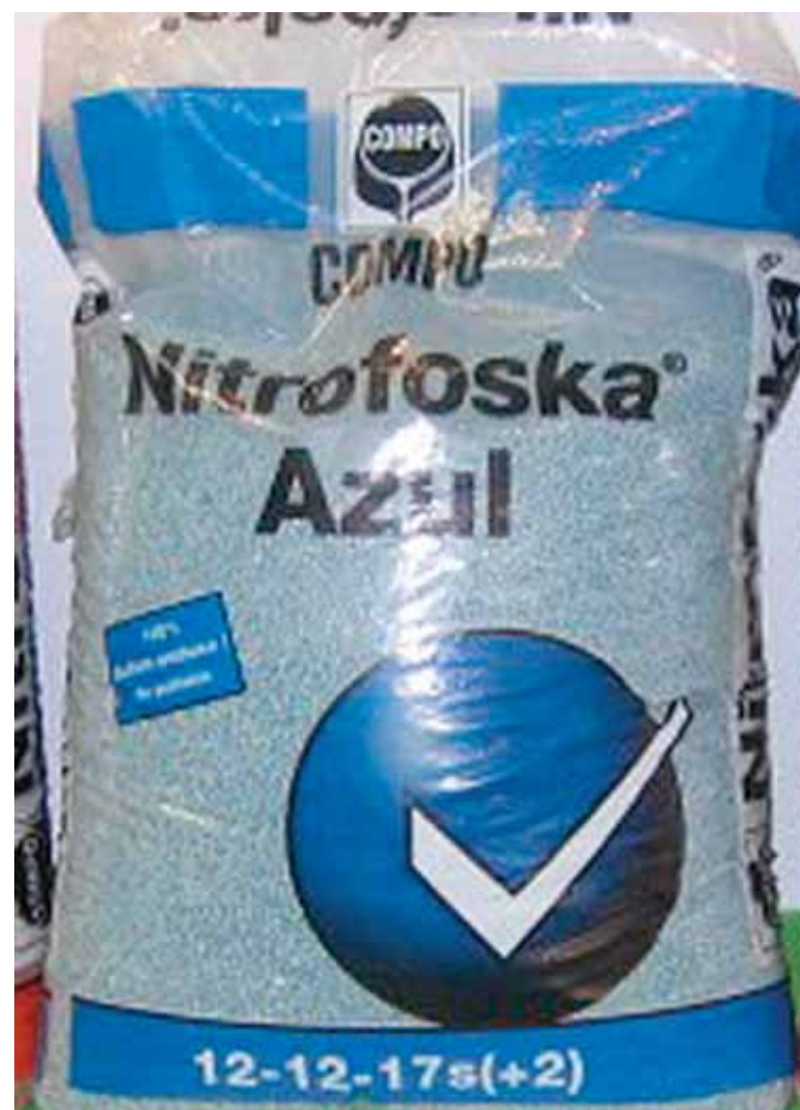
Bolsa de abono a la venta en un establecimiento especializado.