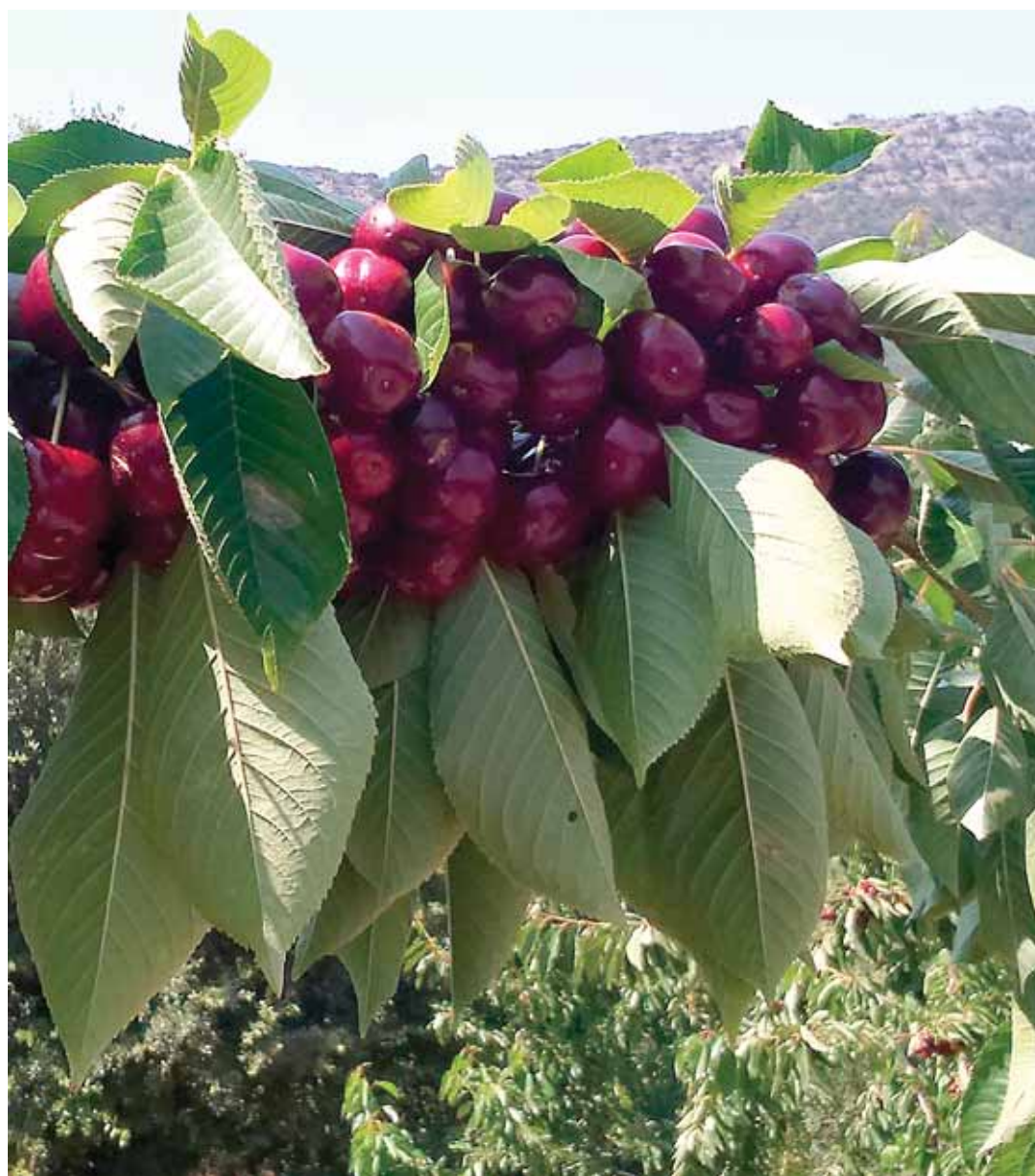
Salvo en las zonas más afectadas por el pedrisco y las lluvias, las cerezas presentan un aspecto inmejorable.

¿Y la manzana? A priori, como en el caso de la cereza, la campaña se presenta «normal», más o menos «como siempre». La diferencia es que se está desarrollando «a su tiempo» y todo parece indicar que la recogida se iniciará a finales de mes para llegar con la «manzana preparada» a la Feria de Cantabranca que se celebrará el 14 de octubre.