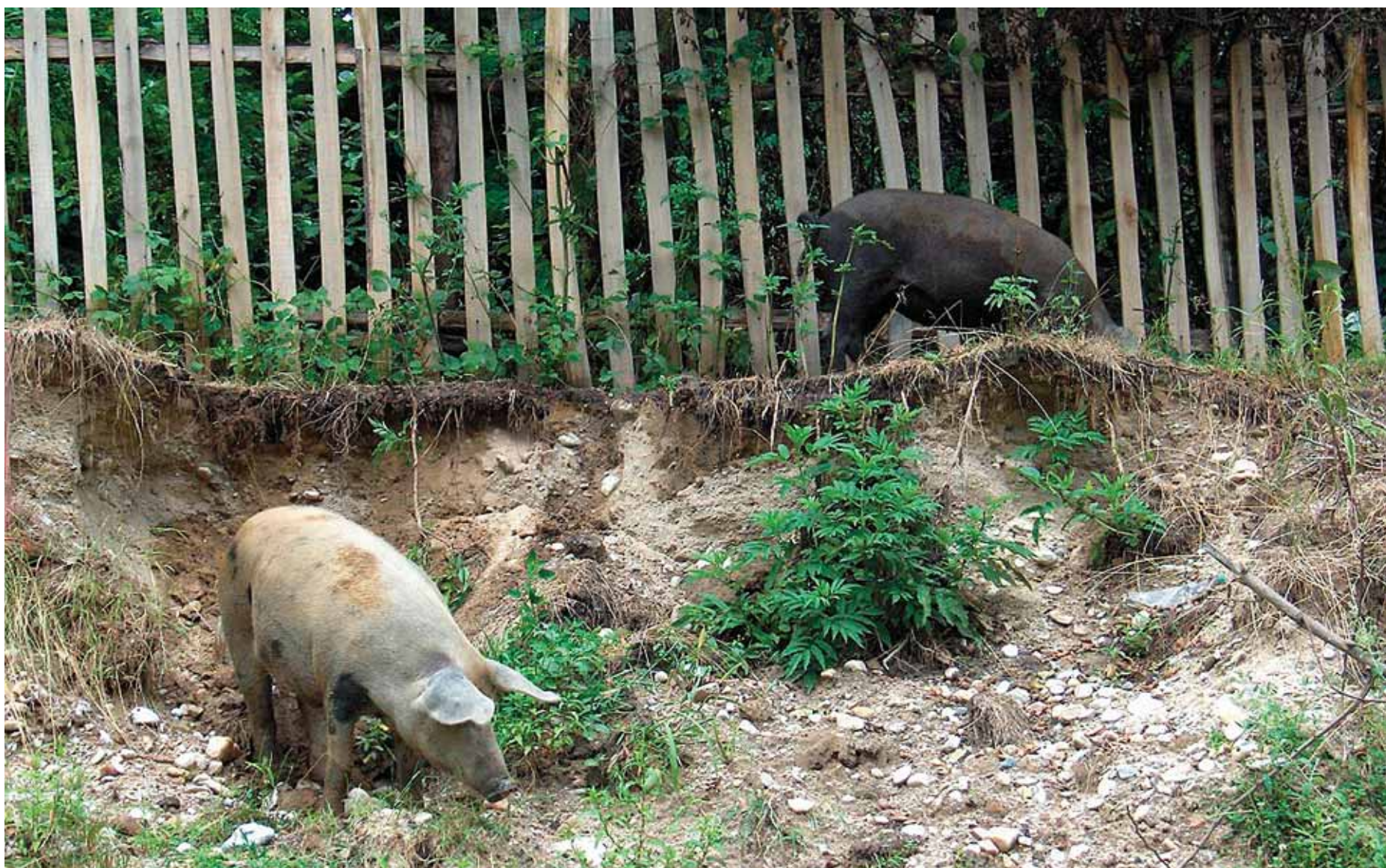
Un cerdo busca alimento en una explotación al aire libre. A su lado, un jabalí hace exactamente lo mismo.