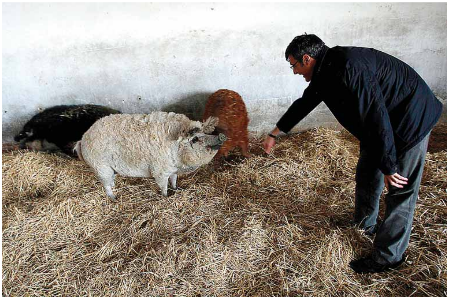
Los ganaderos de la Comunidad también celebran la decisión adoptada por el Ministerio de Agricultura.

Martín conoce el sector a fondo y ha sido testigo de su capacidad creciente para «crear riqueza» durante los últimos años, por no hablar de que la cabaña porcina española -con Castilla y León entre las regiones con mayor potencial- ya exporta fuera en torno al 50% de su pro-