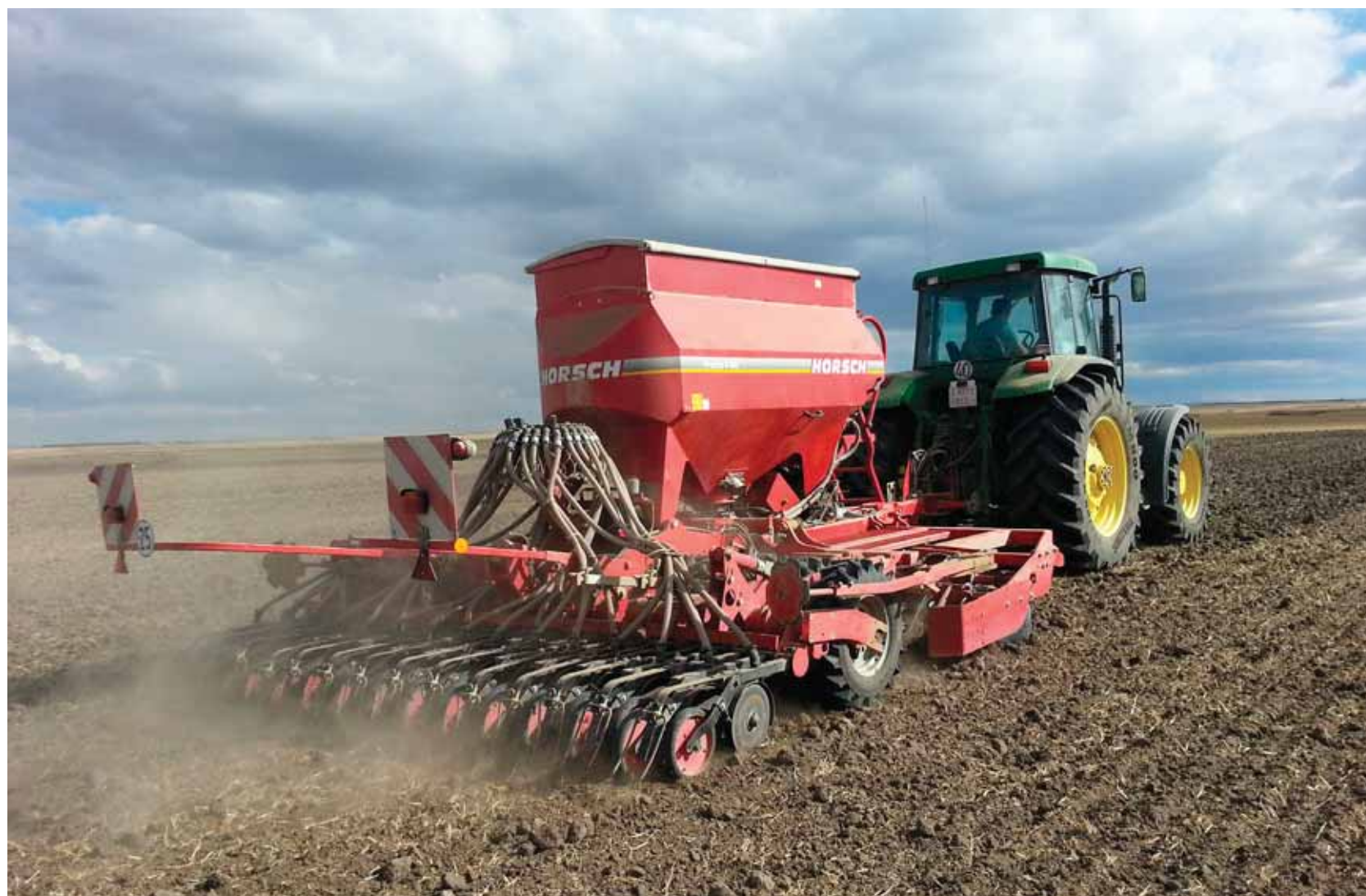
Un agricultor en plena labores de siembra en una parcela de la Comunidad.