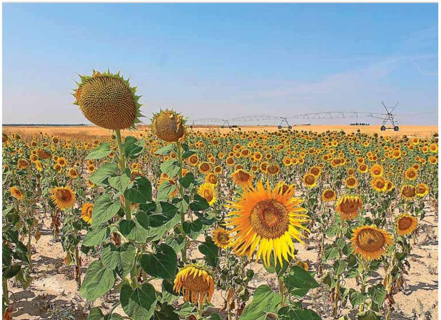
Parcela de girasol en flor en la localidad vallisoletana de Ataquines.

El girasol está «sano, con buenas densidades y desarrollos», como trasladan desde el servicio agronómico de la cooperativa. No se han registrado muchas incidencias sanitarias, lo que ha facilitado el buen desarrollo del cultivo y las buenas perspectivas de cara a la cosecha que arranca estos días en la comunidad.